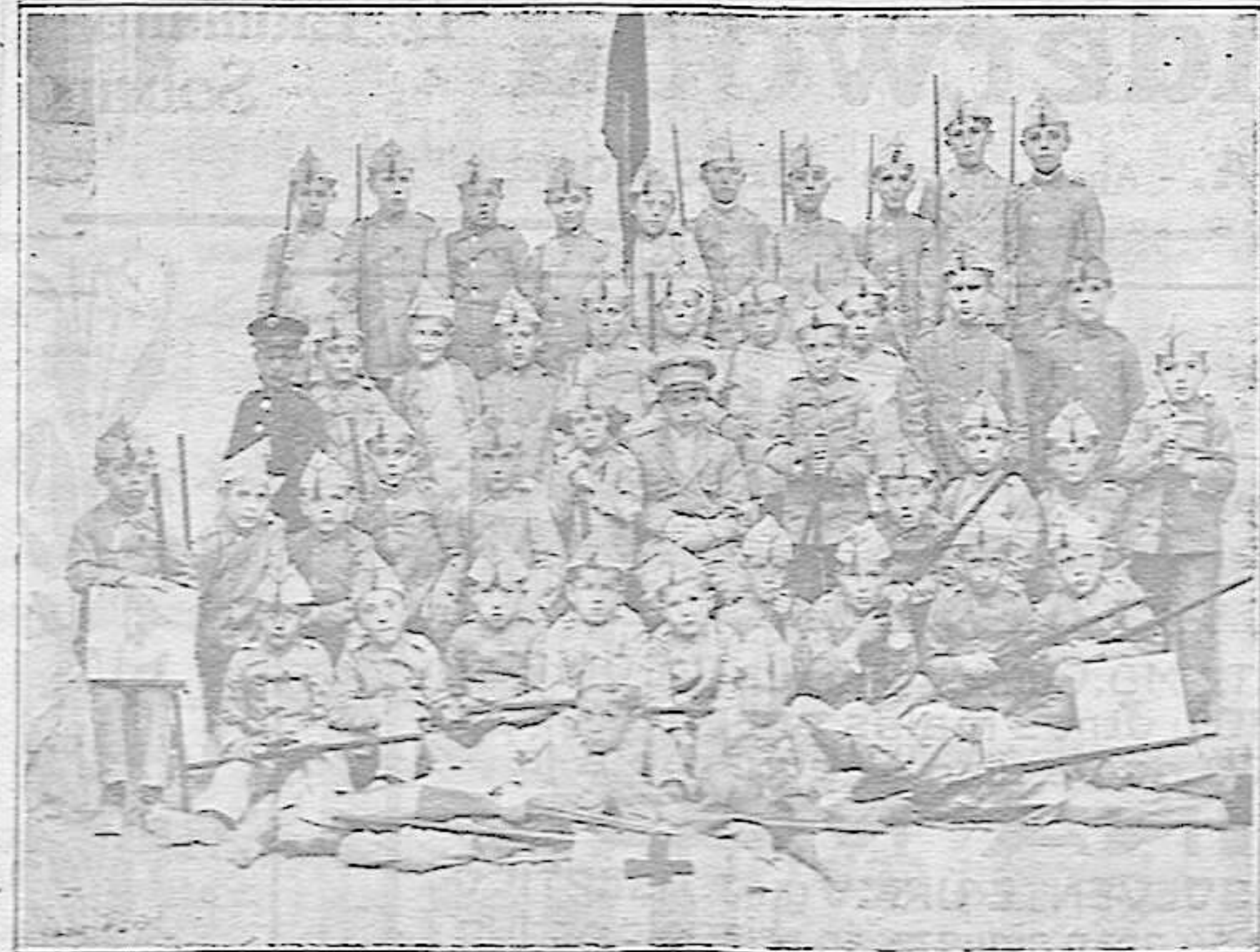
Tomelloso.—Fiesta de la Flor

—Es raro verdad. Yo, siguiendo la tradición familiar debí de ser a'ogado ¿verdad? Pues no. Verá como fué: A mi no me gustaba la carrera de Leyes. Mis aspiraciones eran otras, Yo quería ser