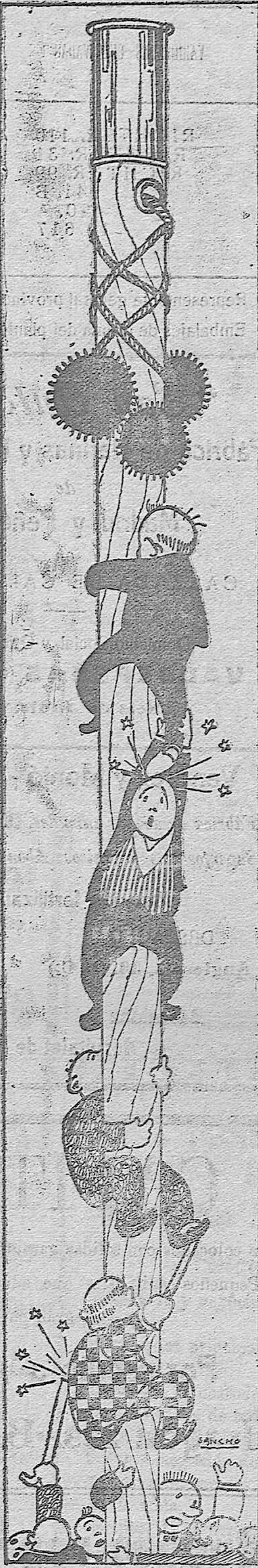
El último suele ser el primero, a la inversa de estos espectáculos.

han hecho nada: digalo sino el ornato, la higiene de la población las costumbres... no han sido otra cosa que el culebrón de la charca. Al que es honrado no le dejan ser Alcalde, y al que no lo es... (censura) ... puntapié... (censura)