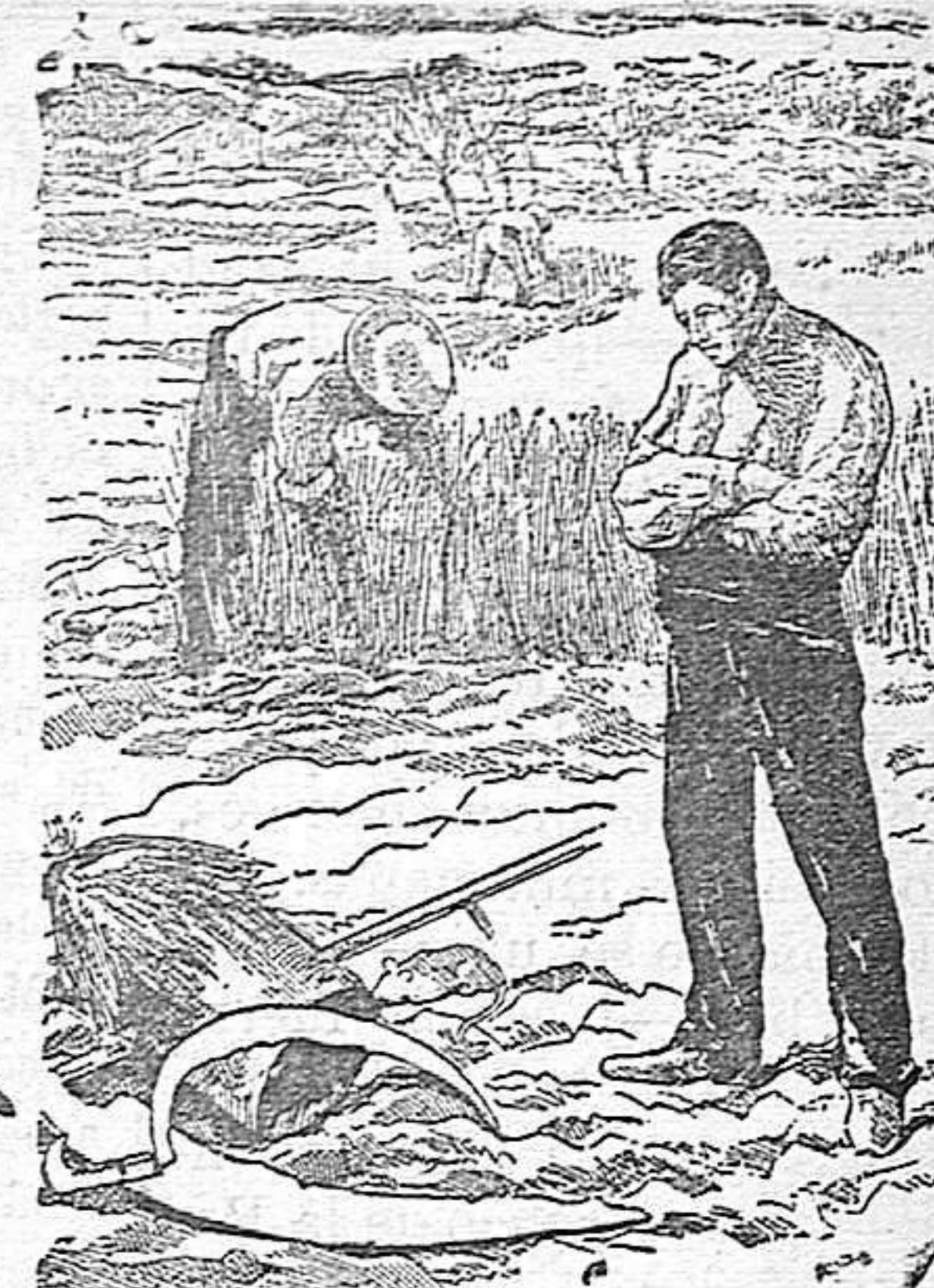
Agricultor rutinario que no lee