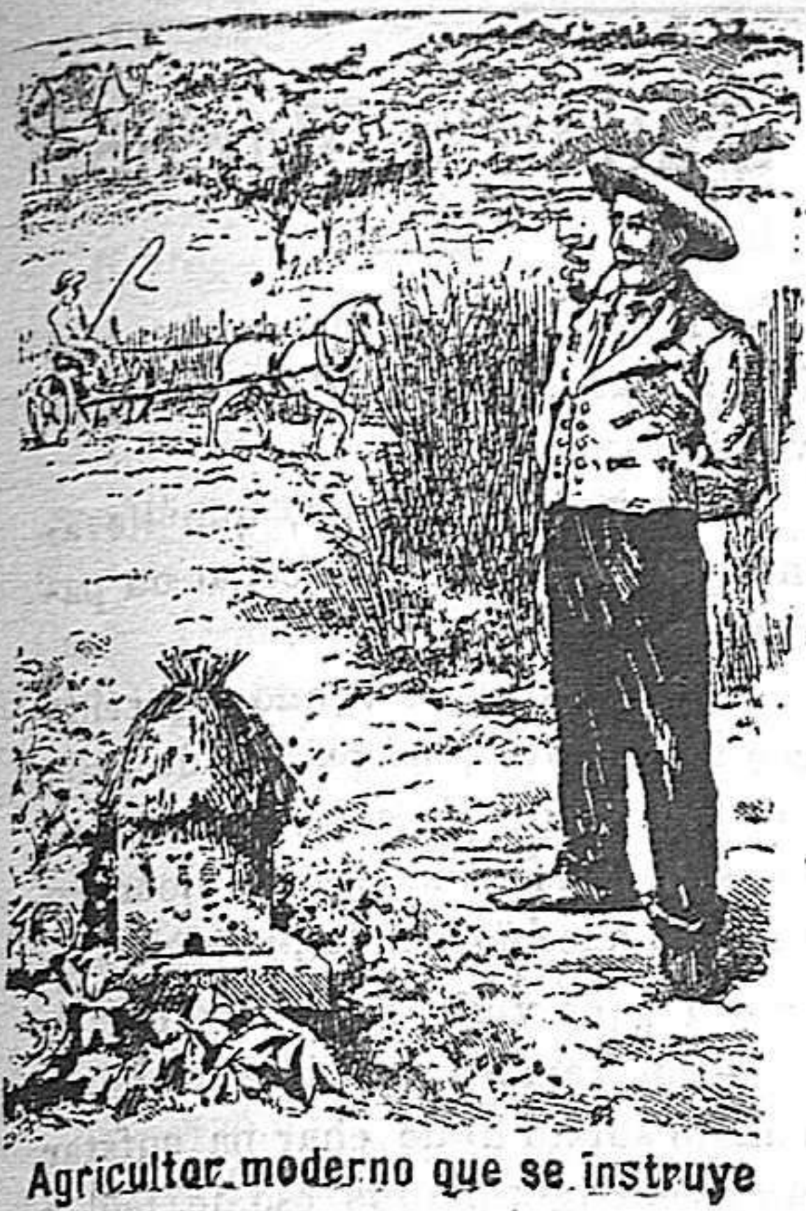
Agricultor moderno que se instruye