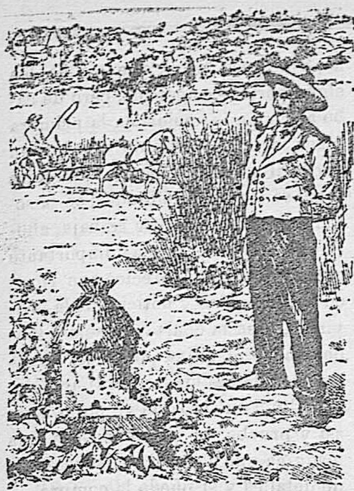
Agricultor moderno que se instruye