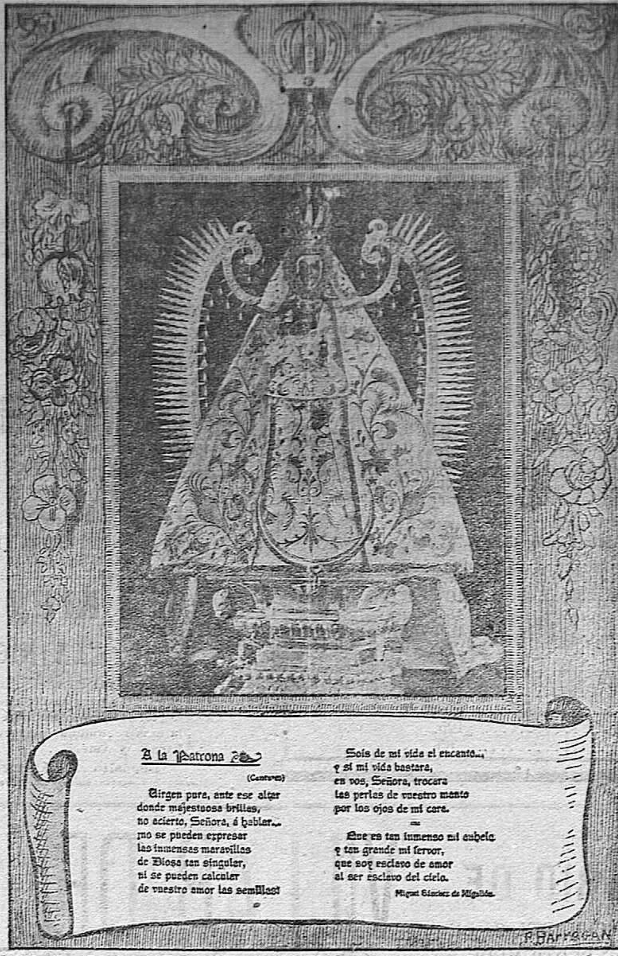
Nuestra Señora del Prado. Excelsa Patrona de Ciudad Real a la que en estos días rinde la capital man...