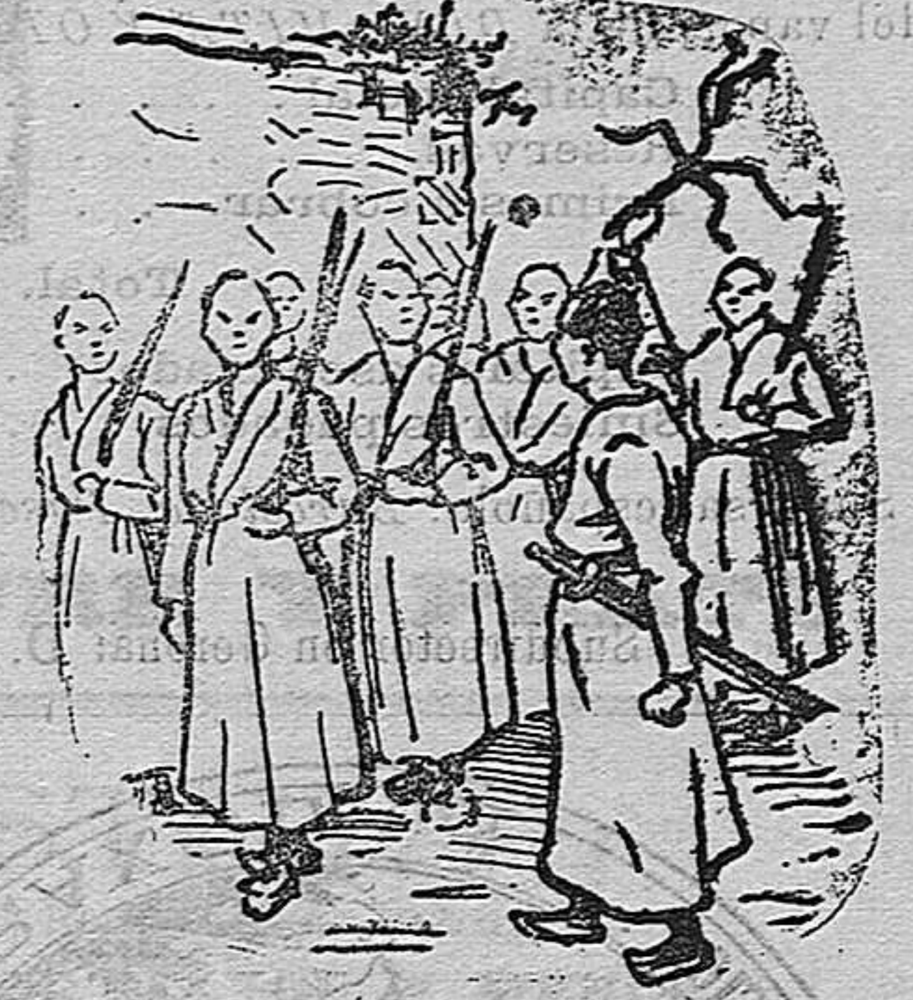
Ejercicios de soldados de infantería, en 1870