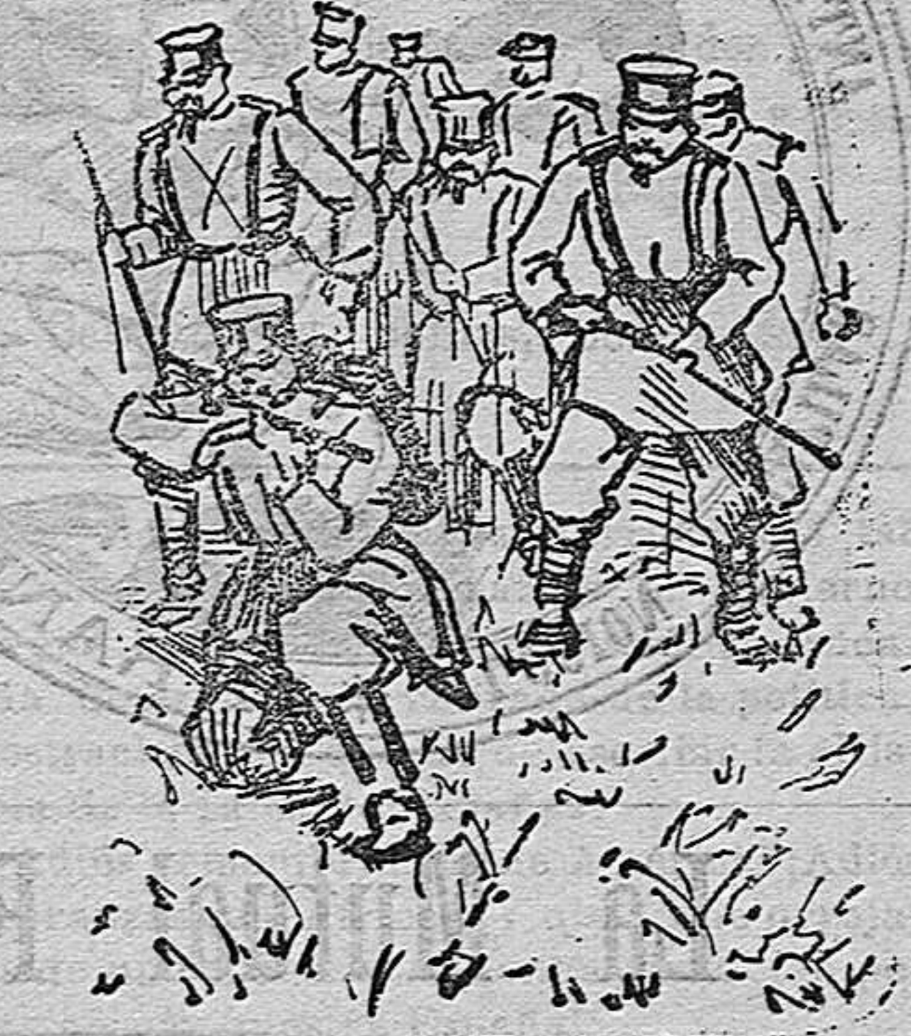
Infantería en campaña, en 1904