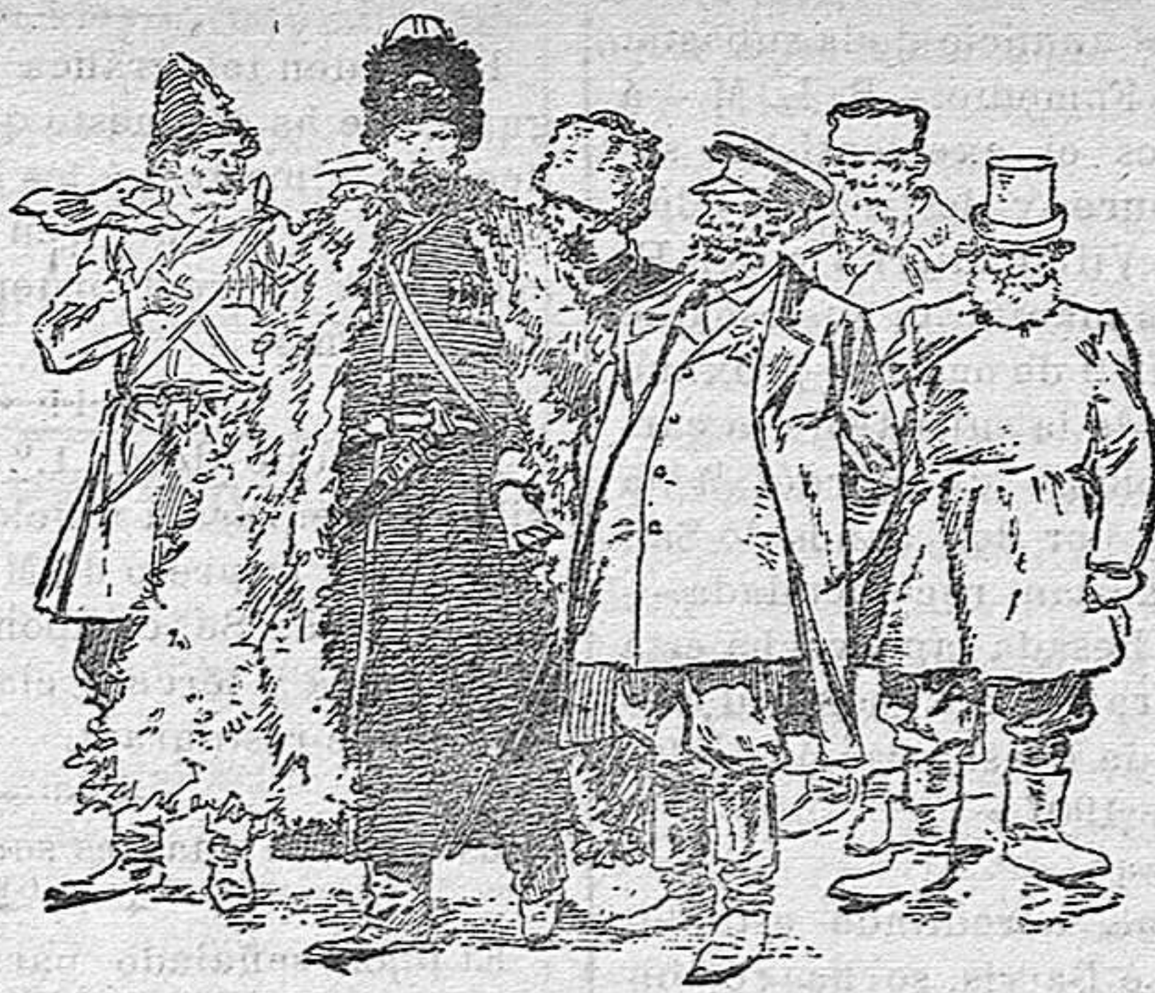
Grupo de los representantes de los zemtvos vistiendo los trajes de sus respectivos países

Recientemente se ha celebrado en Moscú el congreso de los zemtvos sea de los diversos é innumerables municipios que forman el vasto imperio de los czares, poniéndose con tal motivo de relieve cuan variadas y opuestas son las razas sometidas á la autoridad de Nicolás II.