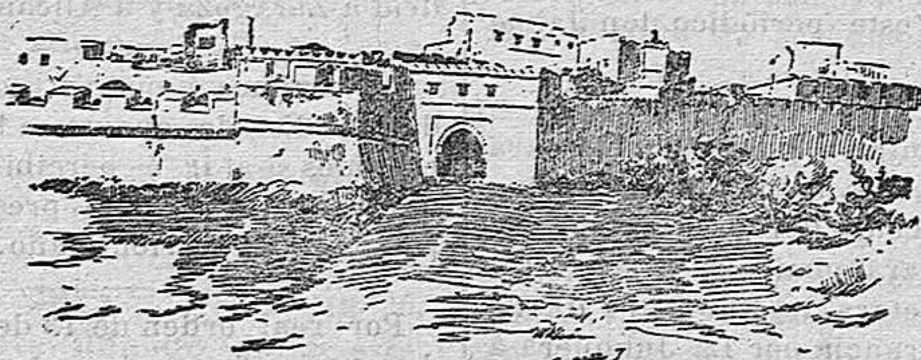
Tetuan = Puerta del camino de Tanger