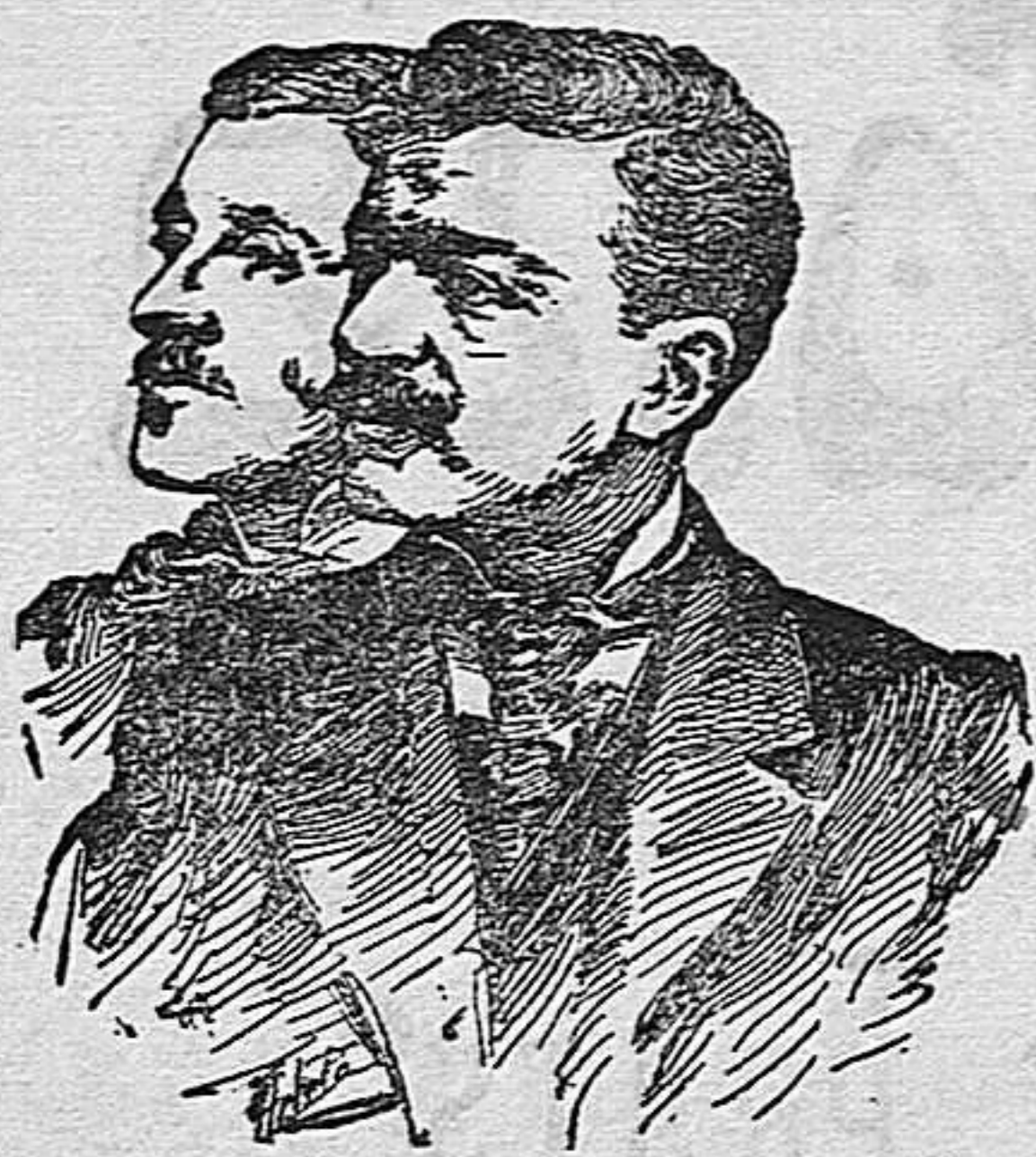
«El genio alegre», comedia de don Serafin y don Joaquin Alvarez Quintero.

Si no tuviese otros muchos méritos indudables la bellísima comedia que los hermanos Alvarez Quintero estrenaron recientemente con merecido éxito en el teatro Español, tendría, á lo menos, el muy recomendable de revelar en sus autores una plausible tendencia, muy lógica en ellos, dados sus temperamentos artísticos: la de conducirnos á romper con el ambiente que invade nuestros primeros teatros; ese ambiente que nos torna pesimistas, induciéndonos á filosofar y convirtiéndonos en misántropos de bilioso mal humor.