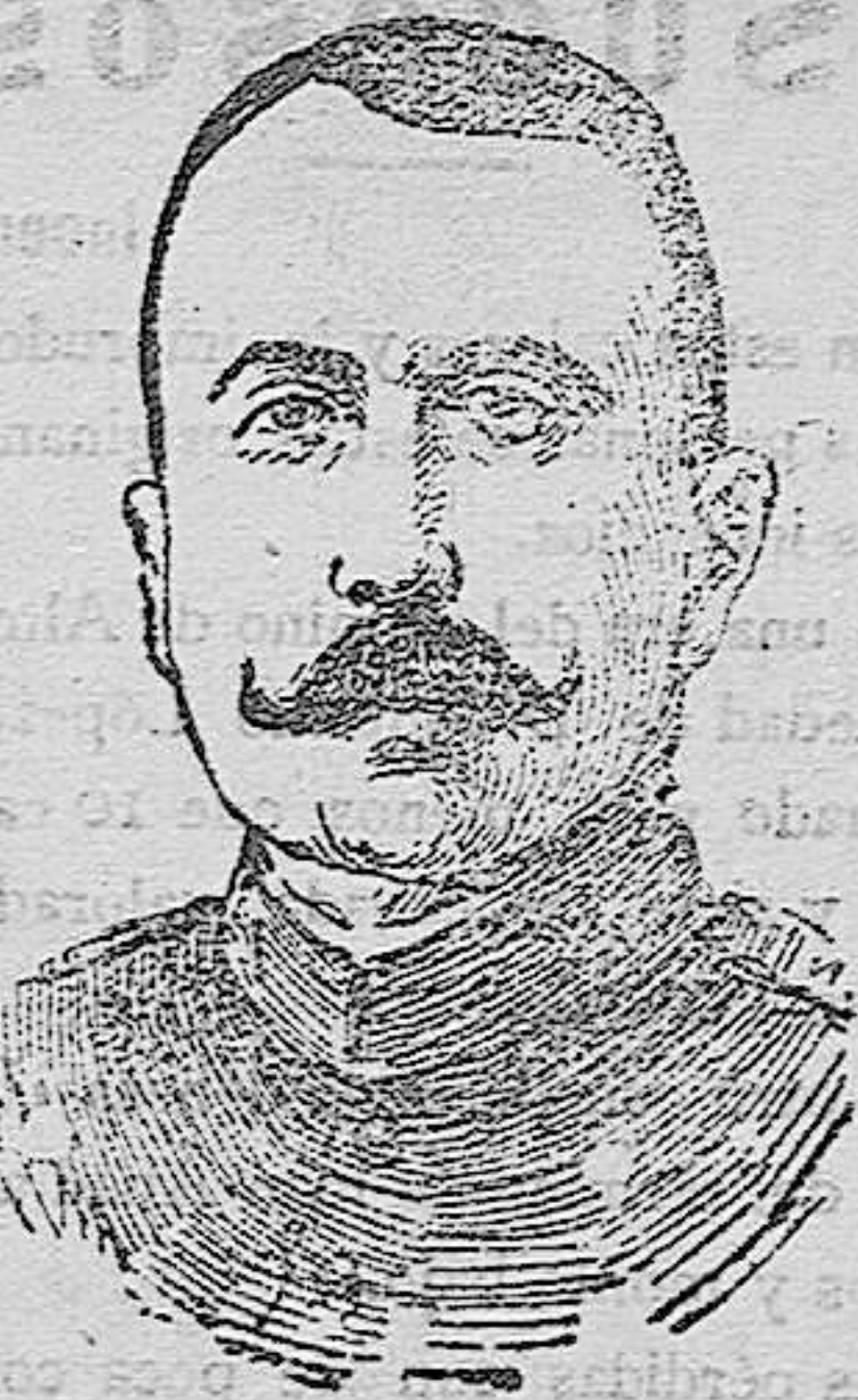
El general Paez Jaramillo, fallecido en Málaga el jueves último

las órdenes superiores, que entrasen los insurrectos en la capital.—demostrando con ello la vergüenza que le producía la capitulación sin lucha.—Más tarde dirigió desde Málaga un telegrama al general Weyler reprochando al Gobierno que hiciese tornar al Ejército sin permitirle combatir hasta el último momento. En 1909 hizo la campaña de Melilla al frente de una media brigada. Se encontró en la desastrosa jornada del barranco del Lobo, en la que sustituyó al general Pintos, cuando éste cayó muerto. Su actuación en esta acción desgraciada motivó críticas acerbas para él, que le afectaron hondísimamente, y que sin duda, le aceleraron la muerte.