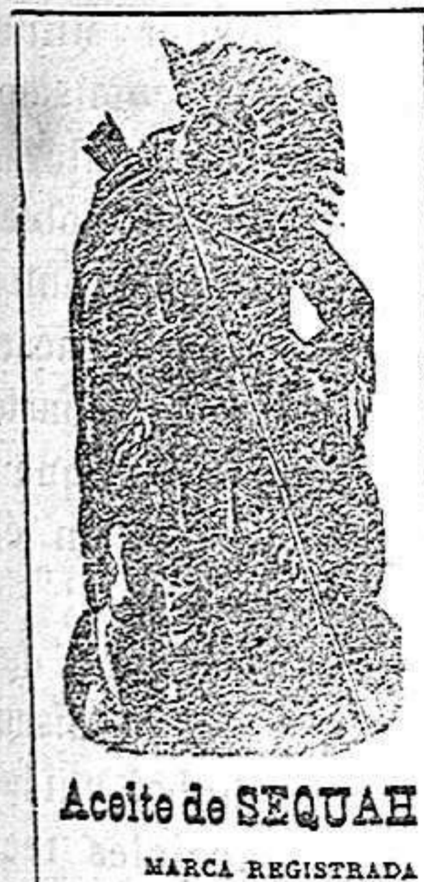
Aceite de SEQUAH MARCA REGISTRADA