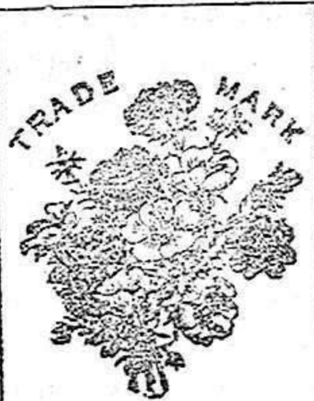
Flor de la Sabana de SEQUAH

No contienen ninguna substancia nociva. Los muchos millares de certificados de personas que deben la curación de sus enfermedades á estos dos preparados y los brillantes elogios de varias corporaciones científicas del mundo entero, son el mejor elogio que pueda dárseles.