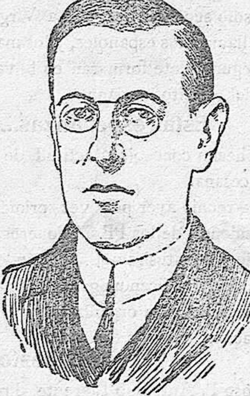
Presidente de Estados Unidos