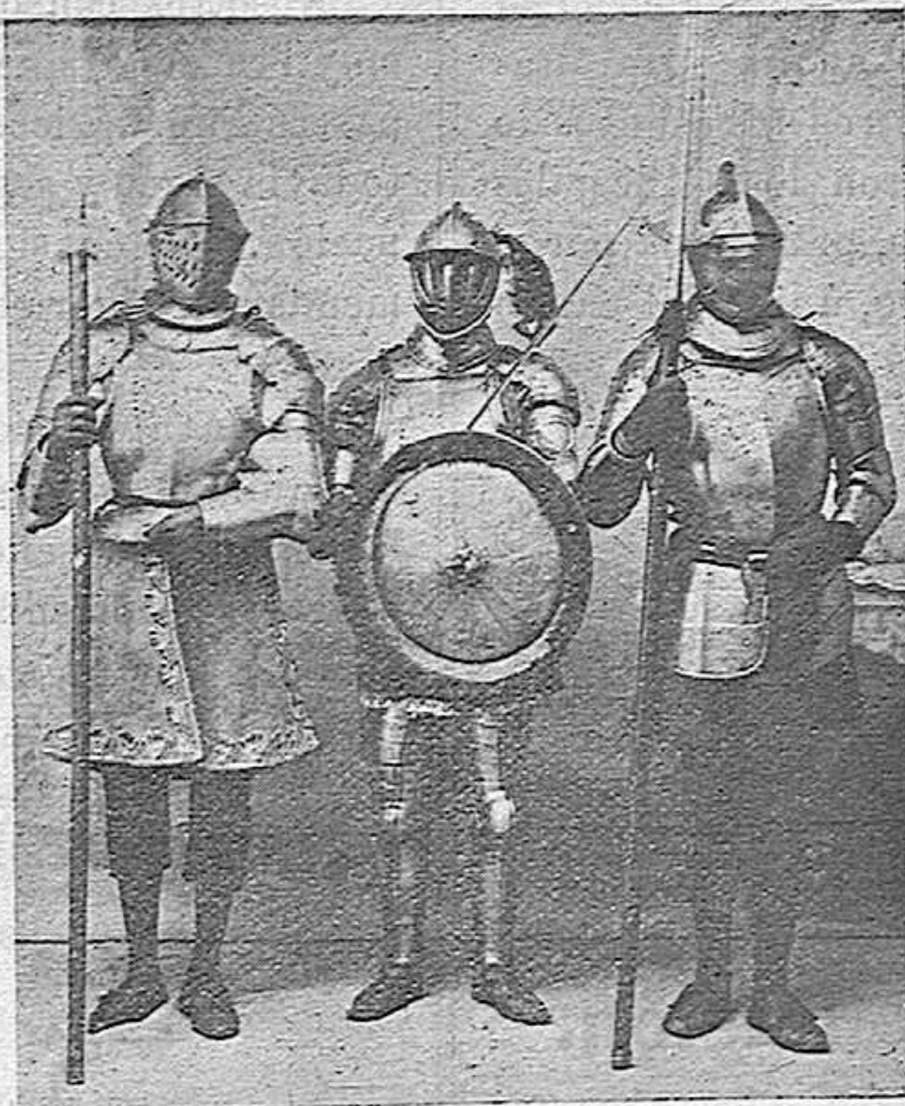
ARMADURAS DEL SIGLO XV

El domingo próximo, según rumor público, se abrirán todas las tabernas de la capital, cansados ya sus dueños de las muchas arbitrariedades cometidas en los domingos últimos, pues en las casas de comidas se vendió vino en gran cantidad sufriendo