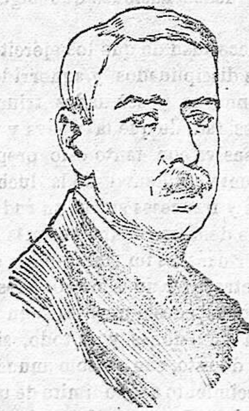
Ministro de Relaciones Exteriores de los Estados Unidos