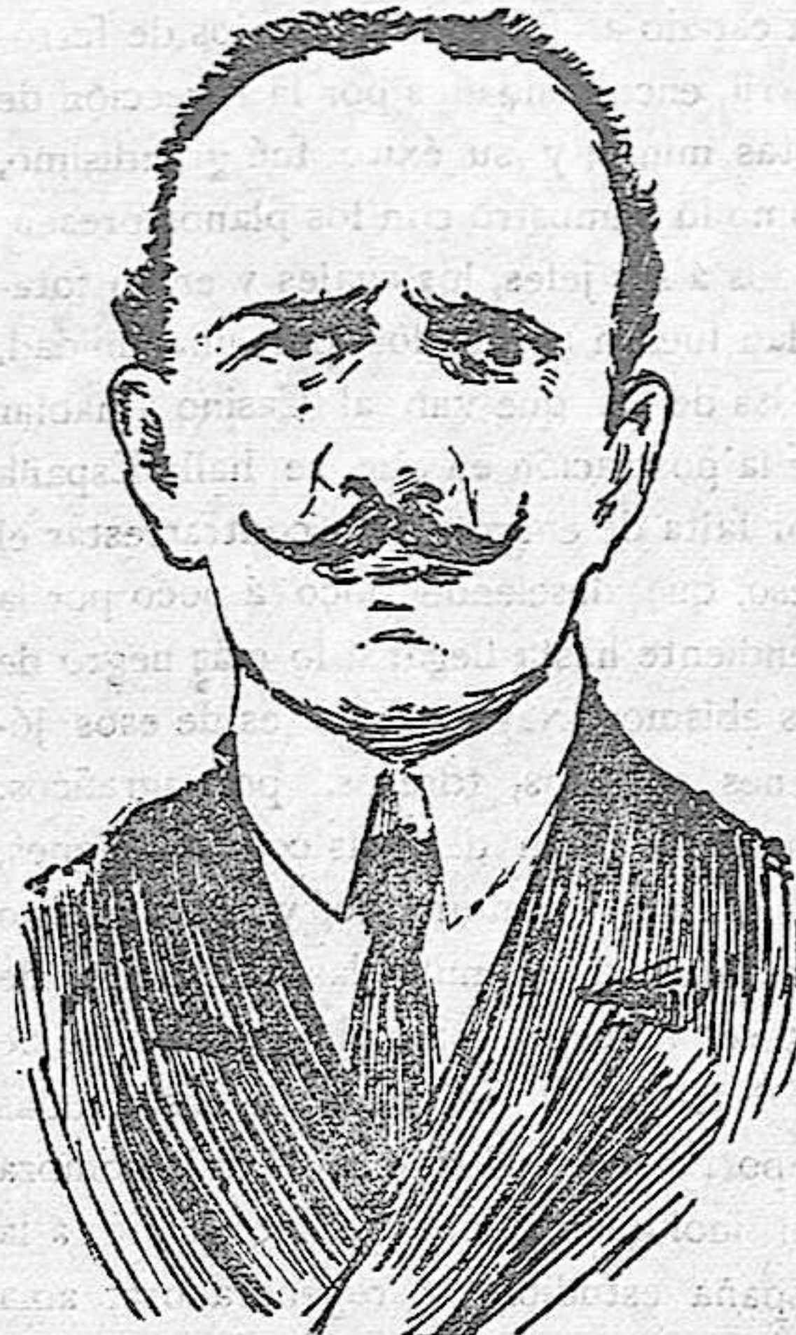
Embajador de Alemania en Washington