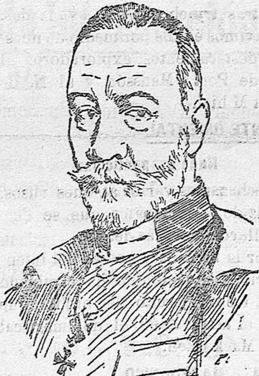
El canceller alemán Bethmann-Holweg

El discurso, en que Bethmann-Holweg comunicó á la Comisión principal del Reichstag la sensacional decisión relativa al empleo ilimitado de los submarinos es una explicación inequívoca de la actitud firme de Alemania en estos momentos decisivos. Nada detiene al Imperio ante la necesidad impuesta de lograr la victoria. Cuando Alemania hizo el ofrecimiento de la paz, se anunció ya más ó menos sotto voce que, si no era aceptado, la guerra sub-