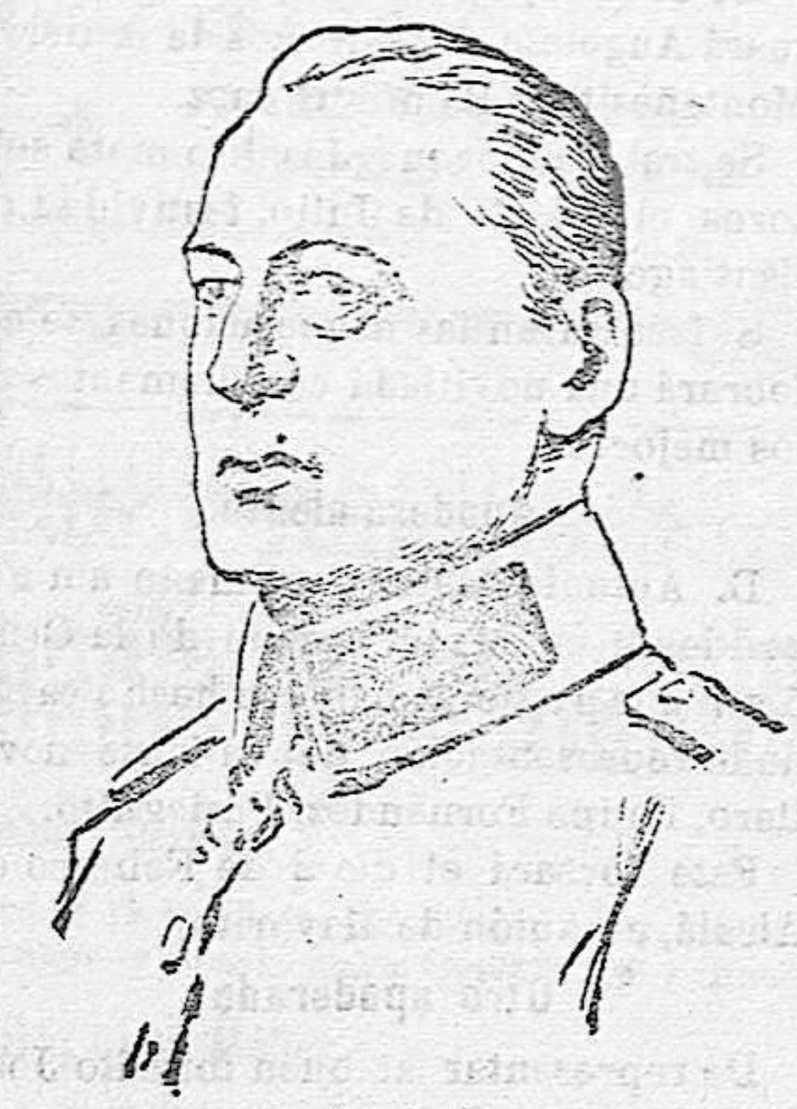
El general von Yerok, comandante del cuerpo del ejército que forma el ala derecha del frente rumano.