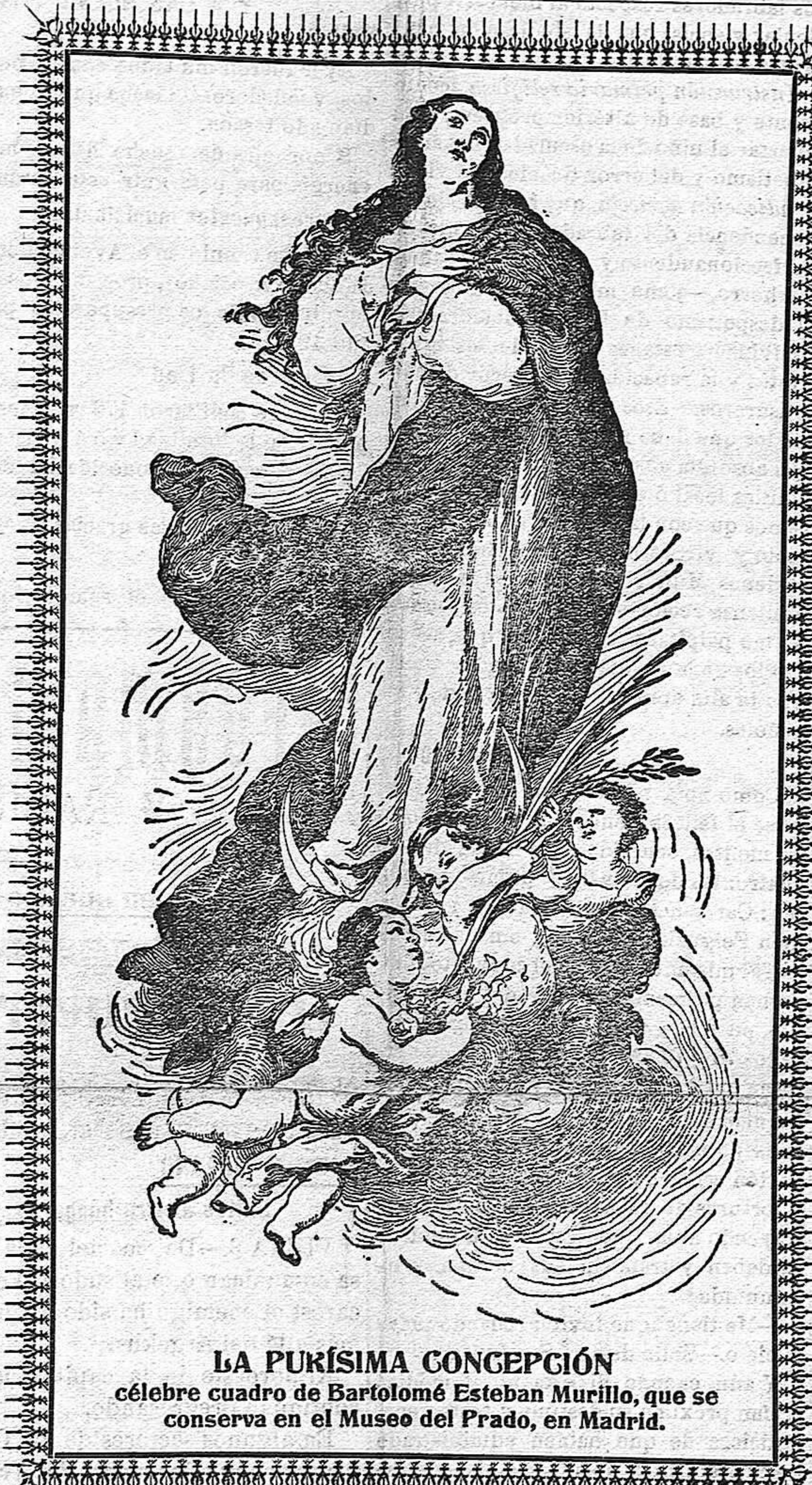
LA PURÍSIMA CONCEPCIÓN célebre cuadro de Bartolomé Esteban Murillo, que se conserva en el Museo del Prado, en Madrid.