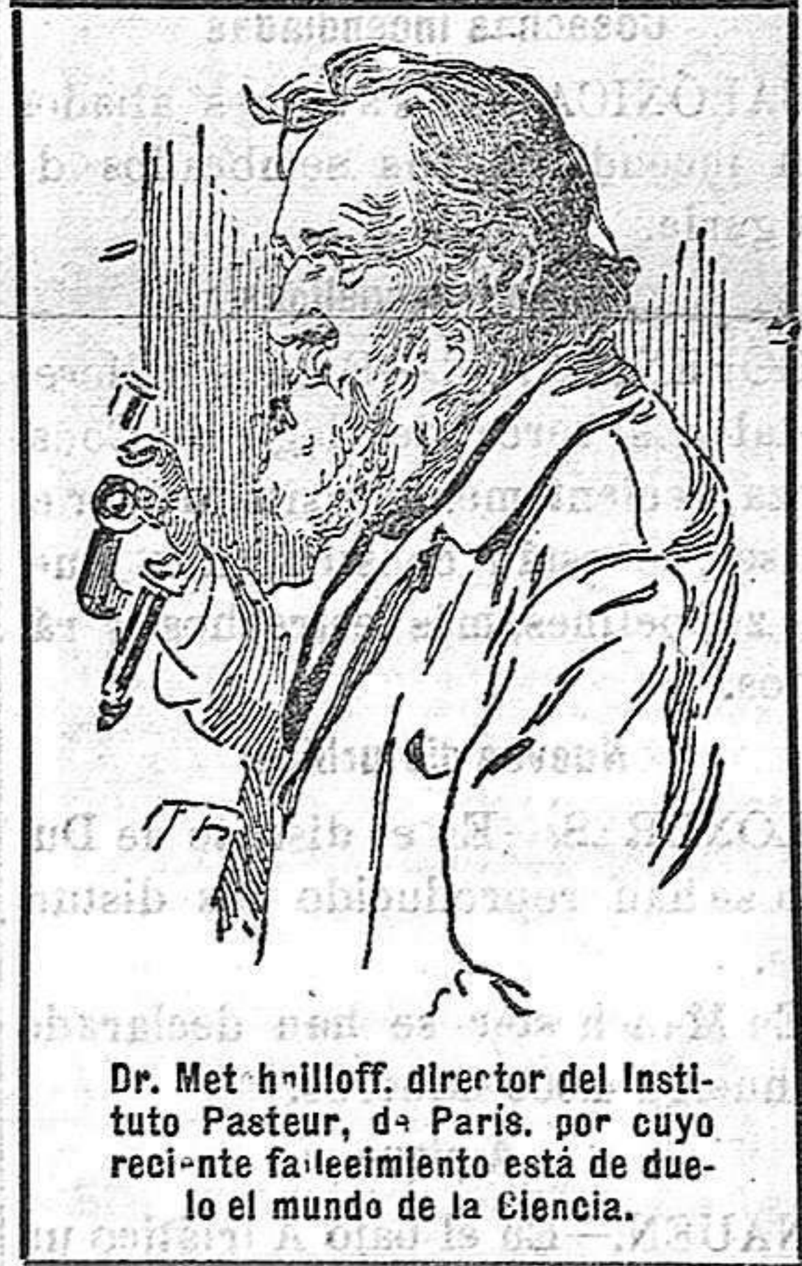
Dr. Met Hilloff, director del Instituto Pasteur, de París, por cuyo reciente fallecimiento está de duelo el mundo de la Ciencia.

Nosotros nos complacemos en hacer pública esta noticia, felicitándole muy sinceramente y deseándole nuevos progresos en la carrera.