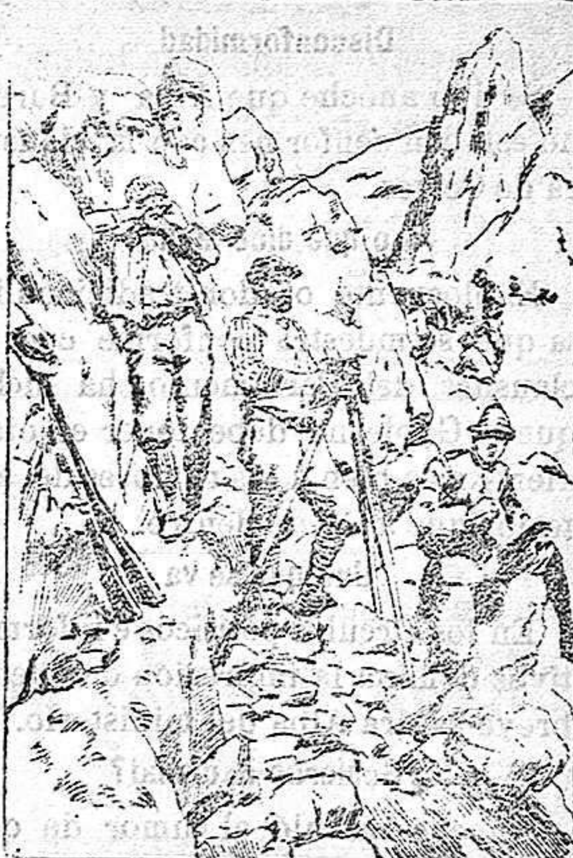
Oficial de alpinos Italianos, transmitiendo órdenes por medio de la telegrafía óptica