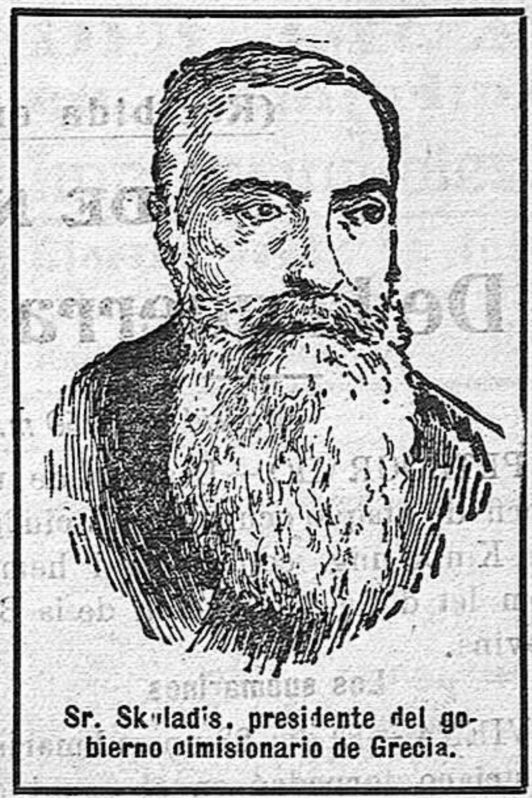
Sr. Skladis, presidente del gobierno dimisionario de Grecia.