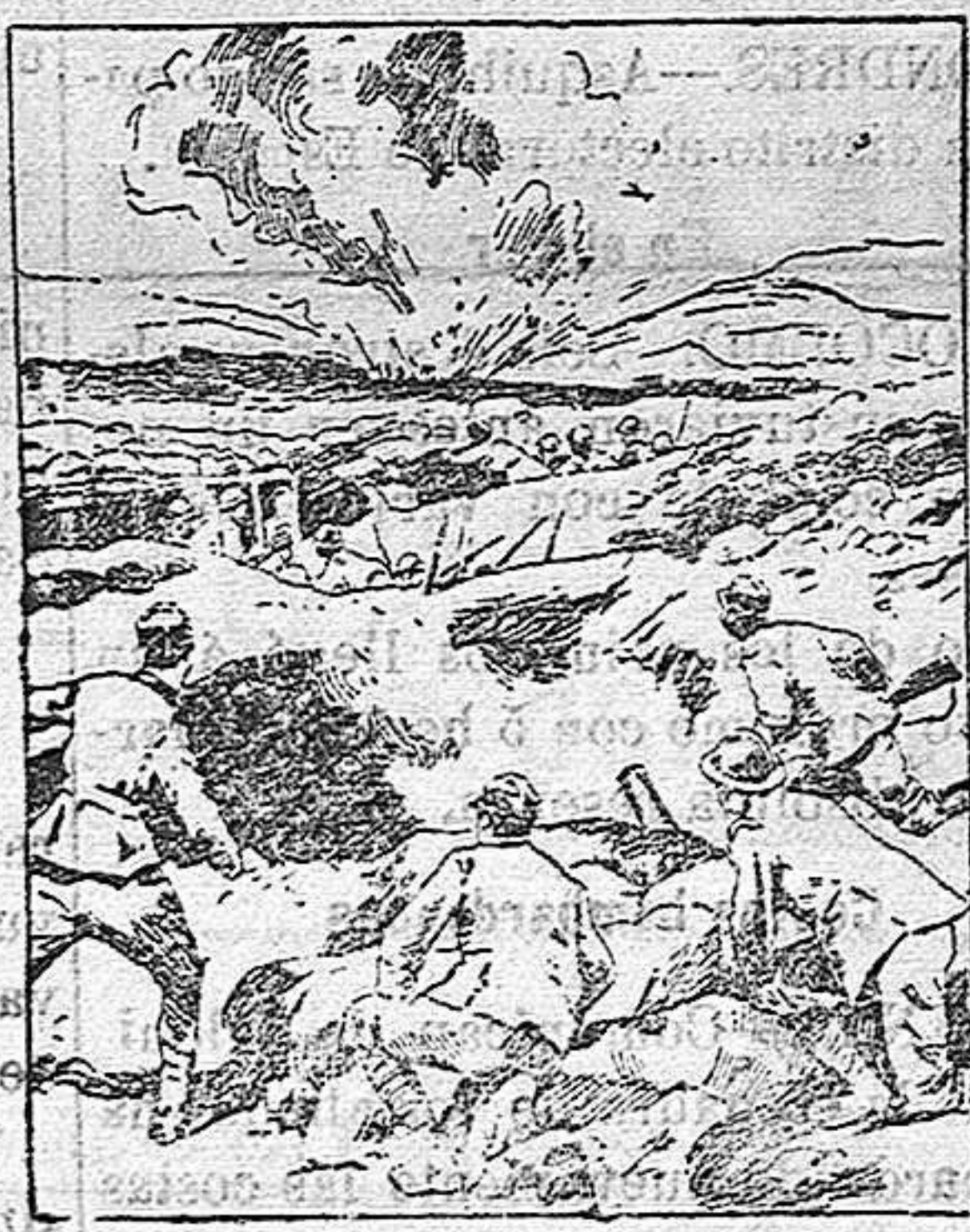
Observando los efectos de un cañón de trisquera sobre las líneas austriacas