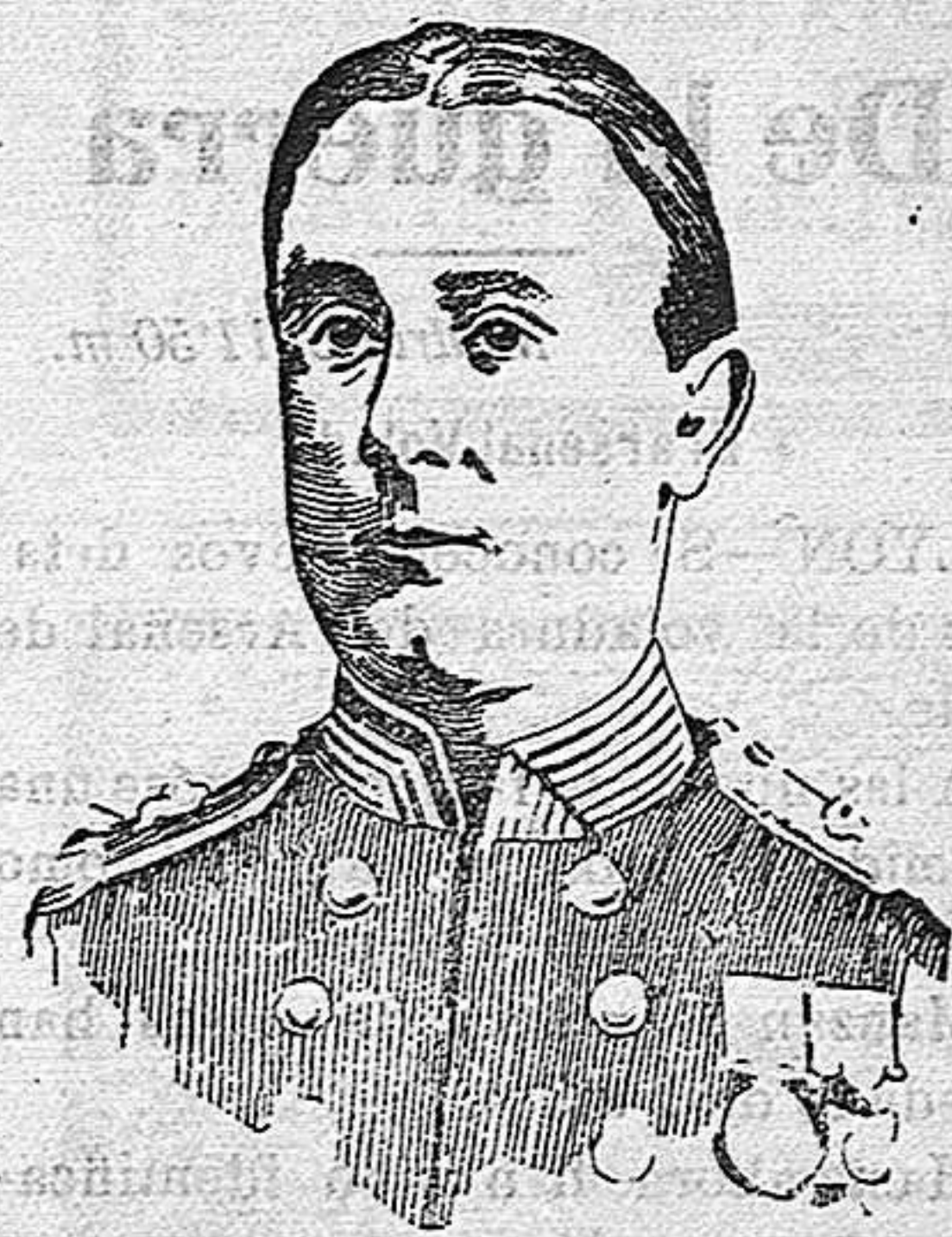
Almirante inglés Jellicoe, que mandando una escuadra de grandes unidades, tomó participación en la última parte de la batalla de Shager Rak.