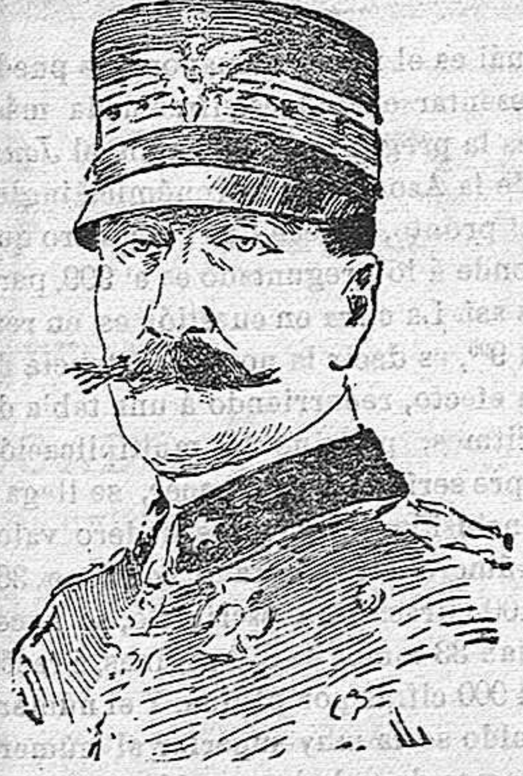
El general Brusatti

El general Brusatti es una víctima más de las intrigas de políticos y palaciegos, que acusaban á él y á su hermano Ugo, primer ayudante de campo de