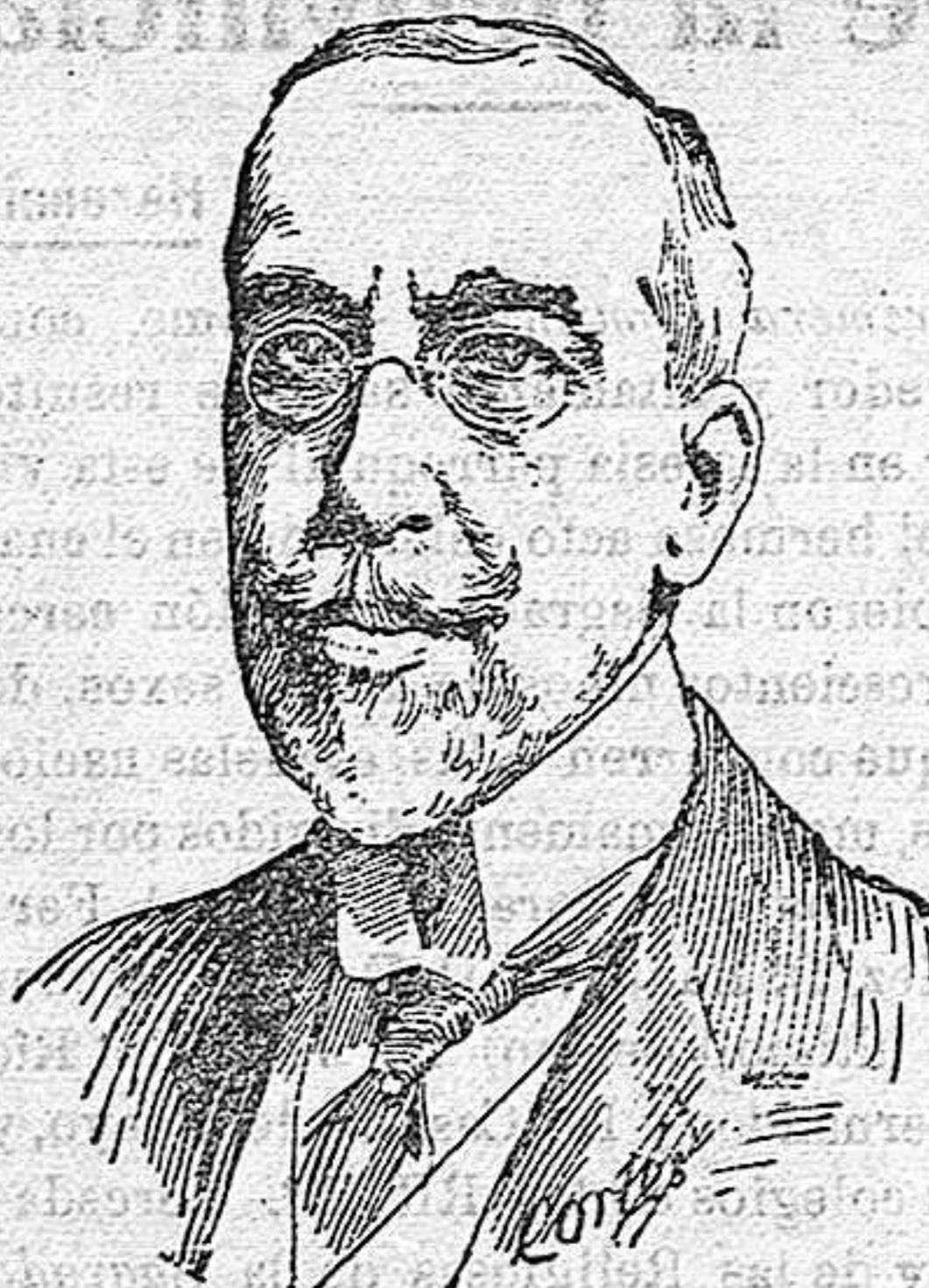
El marqués de Villaurrutia

Su discurso de ingreso versó sobre el «Estilo diplomático», acerca del cual,