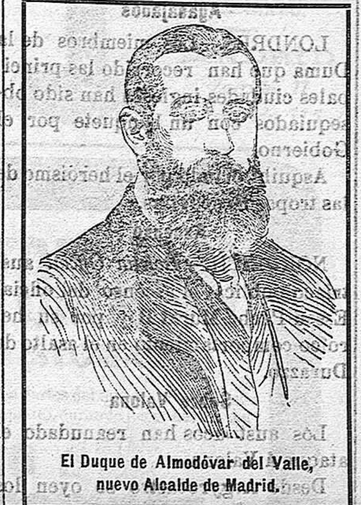
El Duque de Almodóvar del Valle, nuevo Alcalde de Madrid.