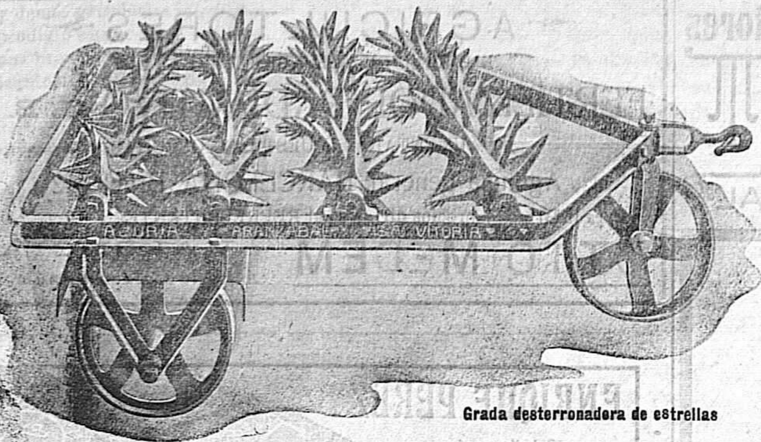
Grada desterronadora de estrellas

ARADOS, DE VERTEDEA de todas clases. GRADAS de muelles, desterronadoras etc. PULVERIZADORES DE ISCOS.-ROBILLOS. CULTIVADORES para viñas, ESPECIALES para rejacar. MOLINOS, QUEBRANTADORES, CORTAARICES, GORTAPAJAS.-SEMBRADORAS DE DISCOS.