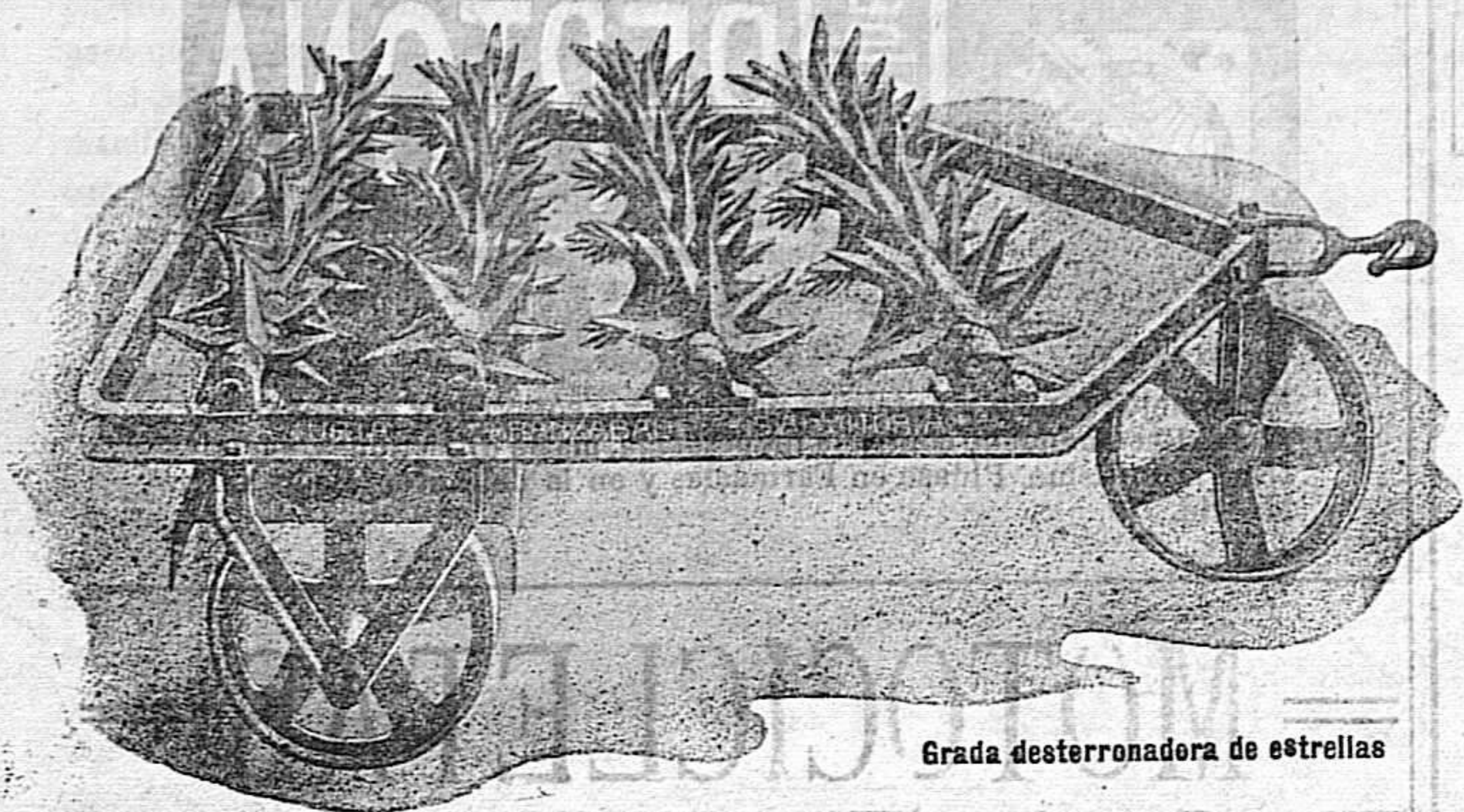
Grada desterronadora de estrellas