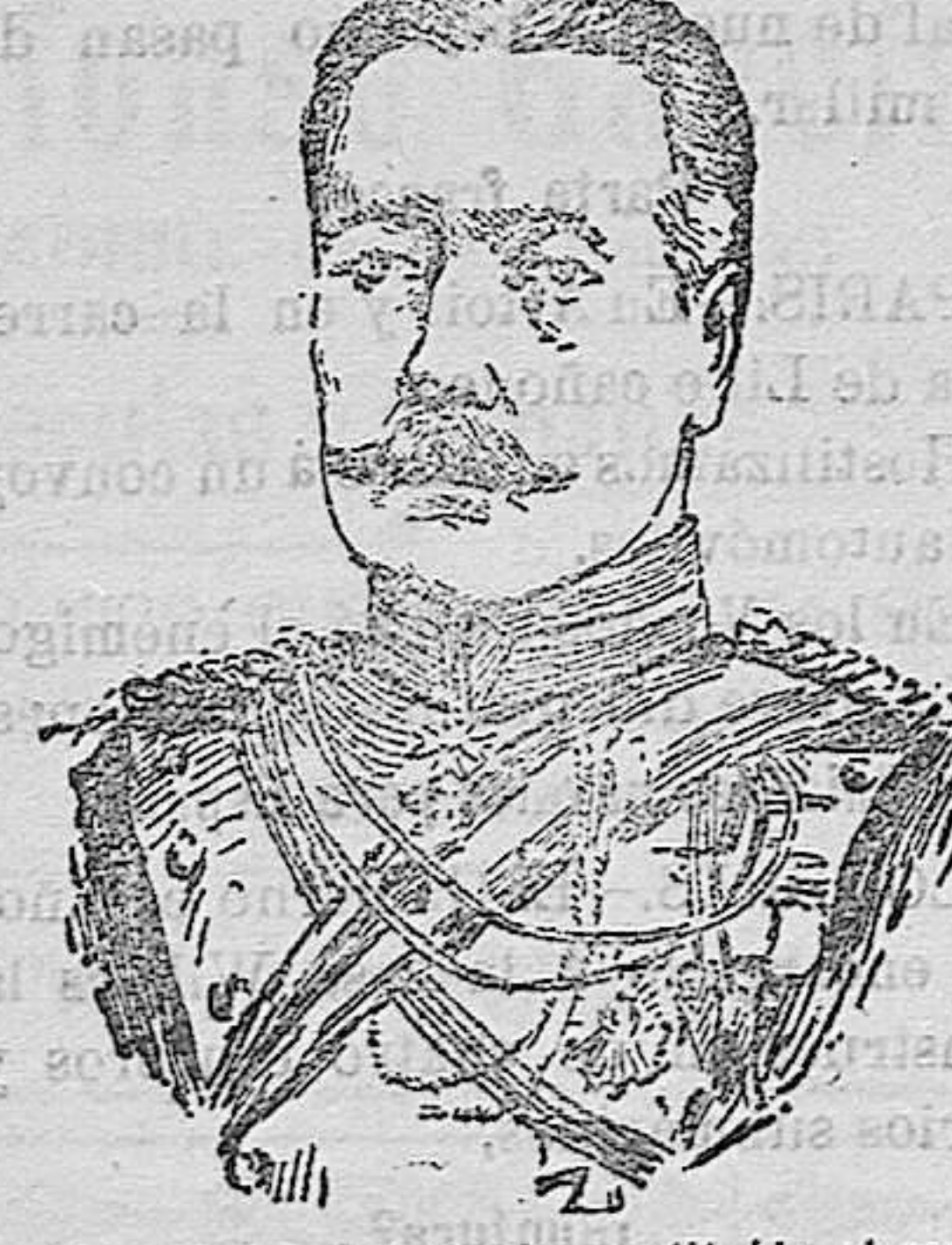
General Douglas que ha sustituido al general French en el mando del ejército inglés que opera en Francia y Bélgica.