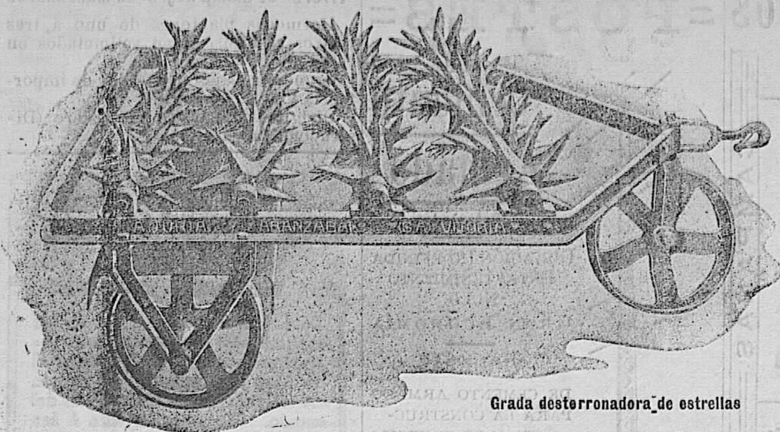
Grada destorronadora de estrellas