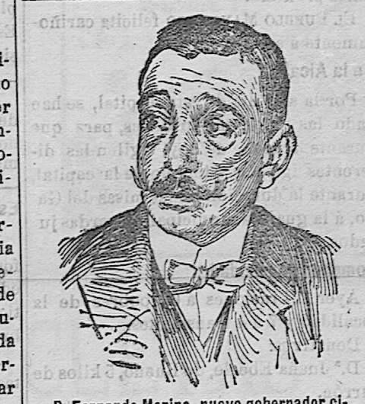
D. Fernando Merino, nuevo gobernador civil de Madrid.