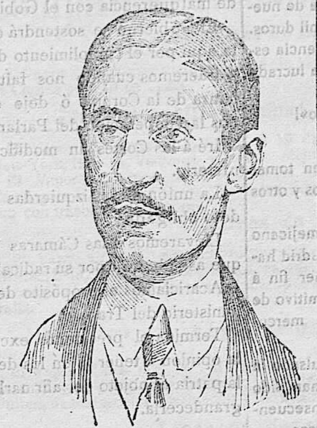
EL MAESTRO USANDIZAGA-AUTOR DE LAS «GOLONDRINAS», FALLECIDO ANTEAYER.