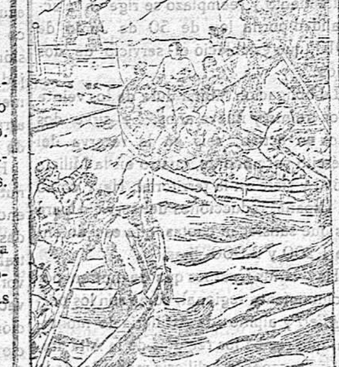
LA TRIPULACIÓN DE UN BARCO MERCANTE ABANDONANDO ÉSTE, MOMENTOS ANTES DE SER HUNDIDO POR UN SUBMARINO ALEMÁN.