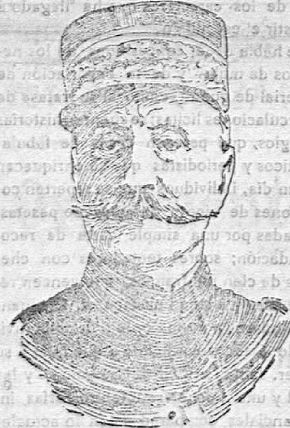
GENERAL FOCH QUE MANDA EL EJERCITO FRANCÉS DEL ARTOIS