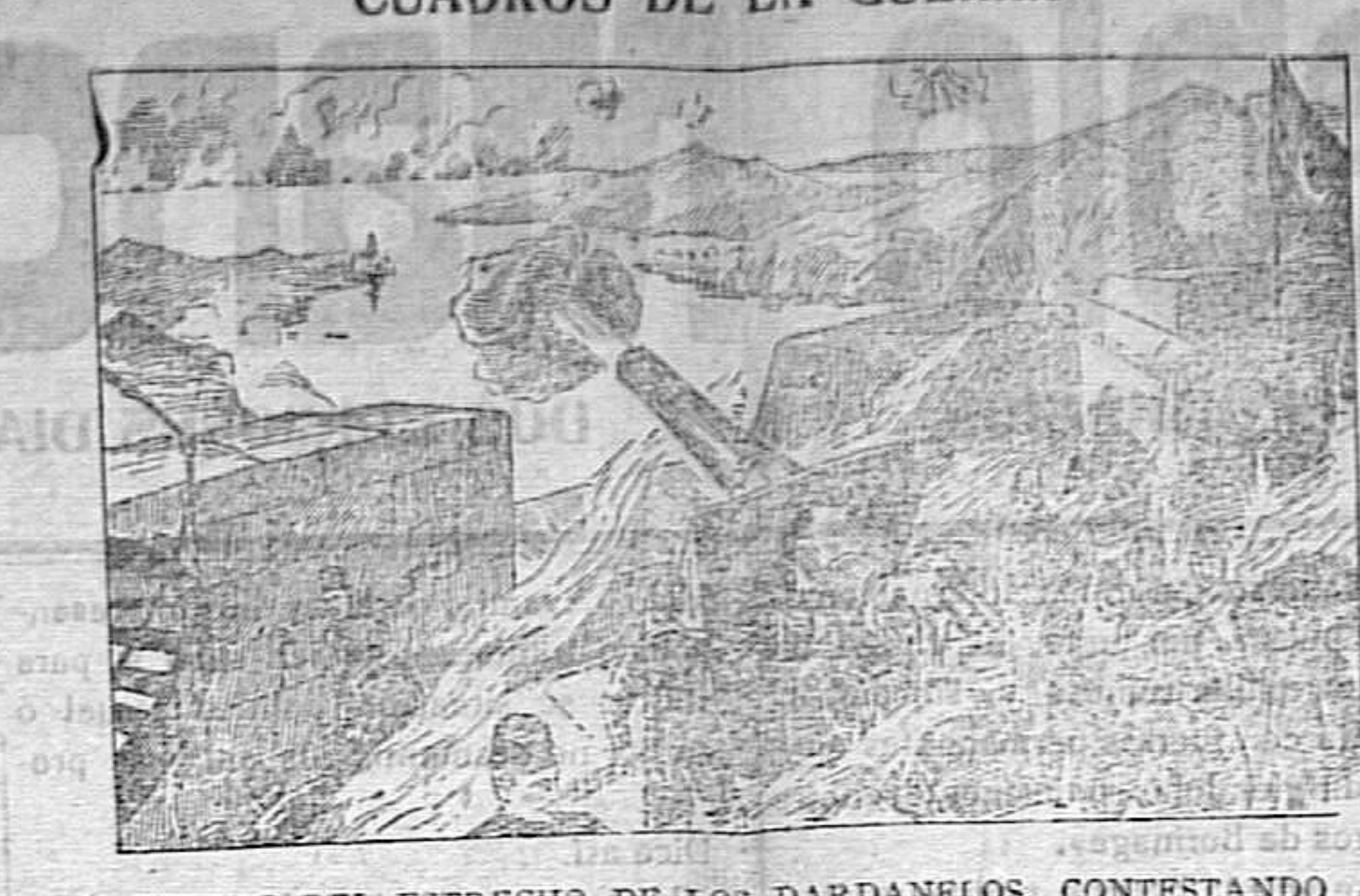
UN FUERTE DEL ESTRECHO DE LOS DARDANELOS, CONTESTANDO AL FUEGO DE LA ESCUADRA ANGLO-FRANCESA.

conciliación para resolver todas las cuestiones internacionales. Que todos los Estados se obliguen a tomar los acuerdos diplomáticos, militares y económicos necesarios para meter en cintura al Estado que obrara militarmente negándose a someter su causa al juicio del mentado Tribunal, ó á buscar justicia por los pacíficos procedimientos indicados.