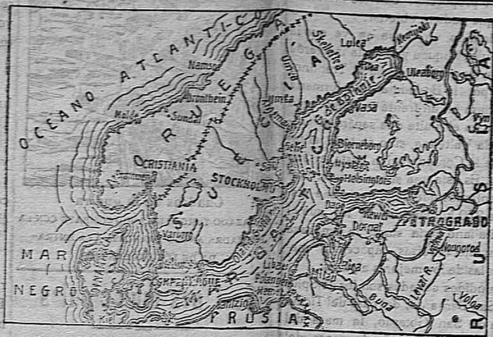
GRÁFICO DE LAS PROVINCIAS RUSAS DEL BÁLTIICO ÚLTIMAMENTE INVADIDAS POR EL EJÉRCITO ALEMÁN