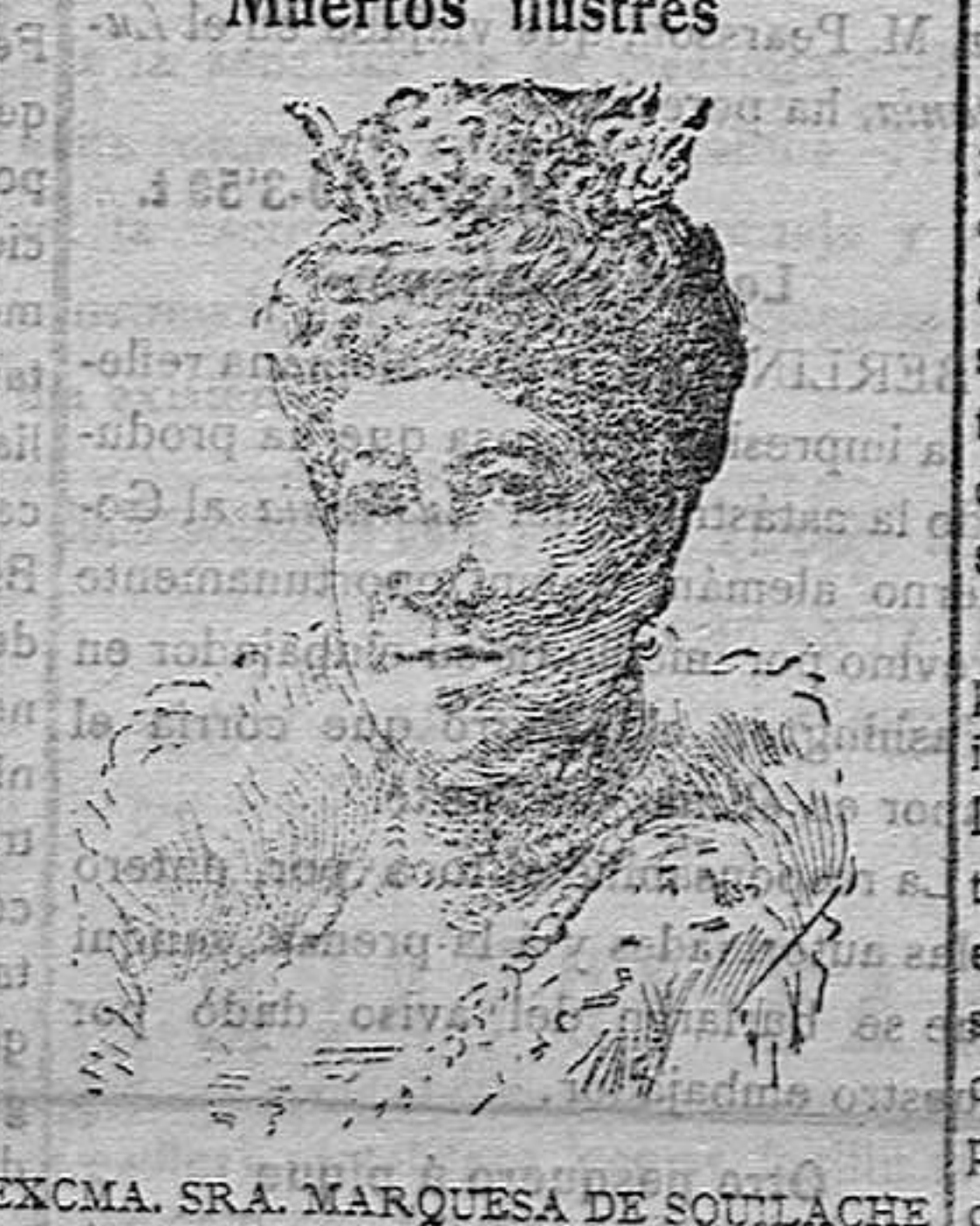
EXCMA. SRA. MARQUESA DE SQUILLACHE