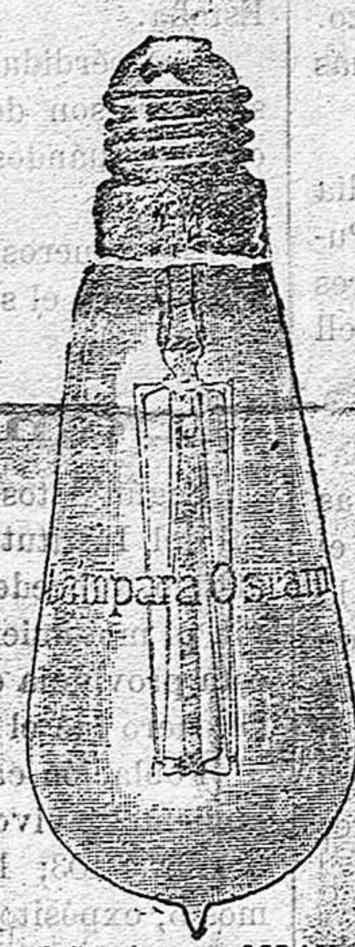
Exíjase la marca OSRAM grabada en el cristal