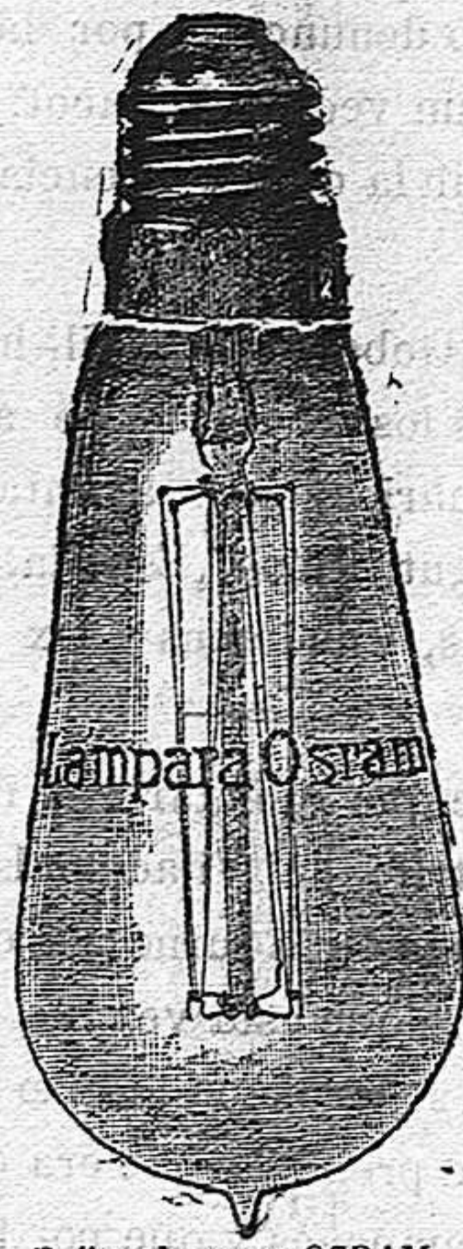
Exíjase la marca OSRAM grabada en el cristal