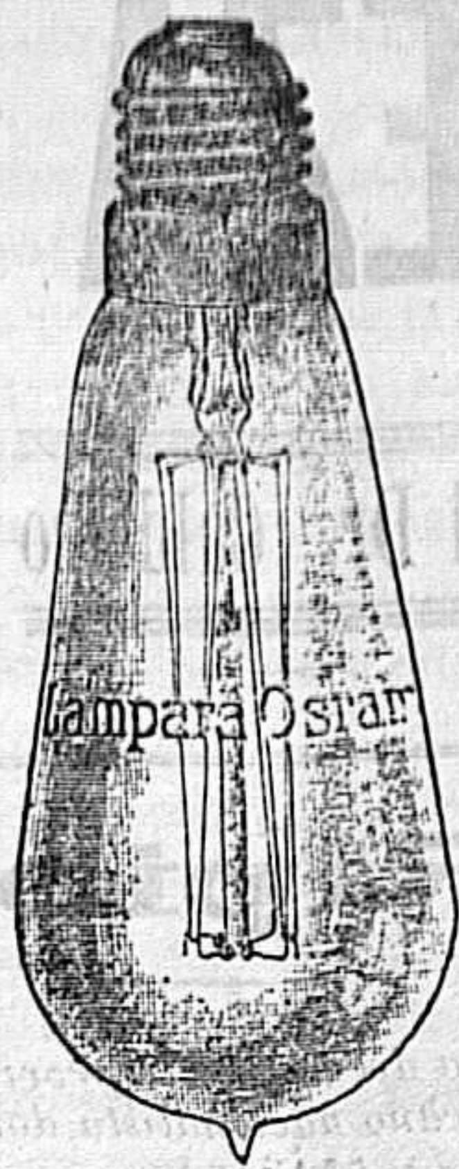
Exijase la marca OSRAM grabada en el cristal