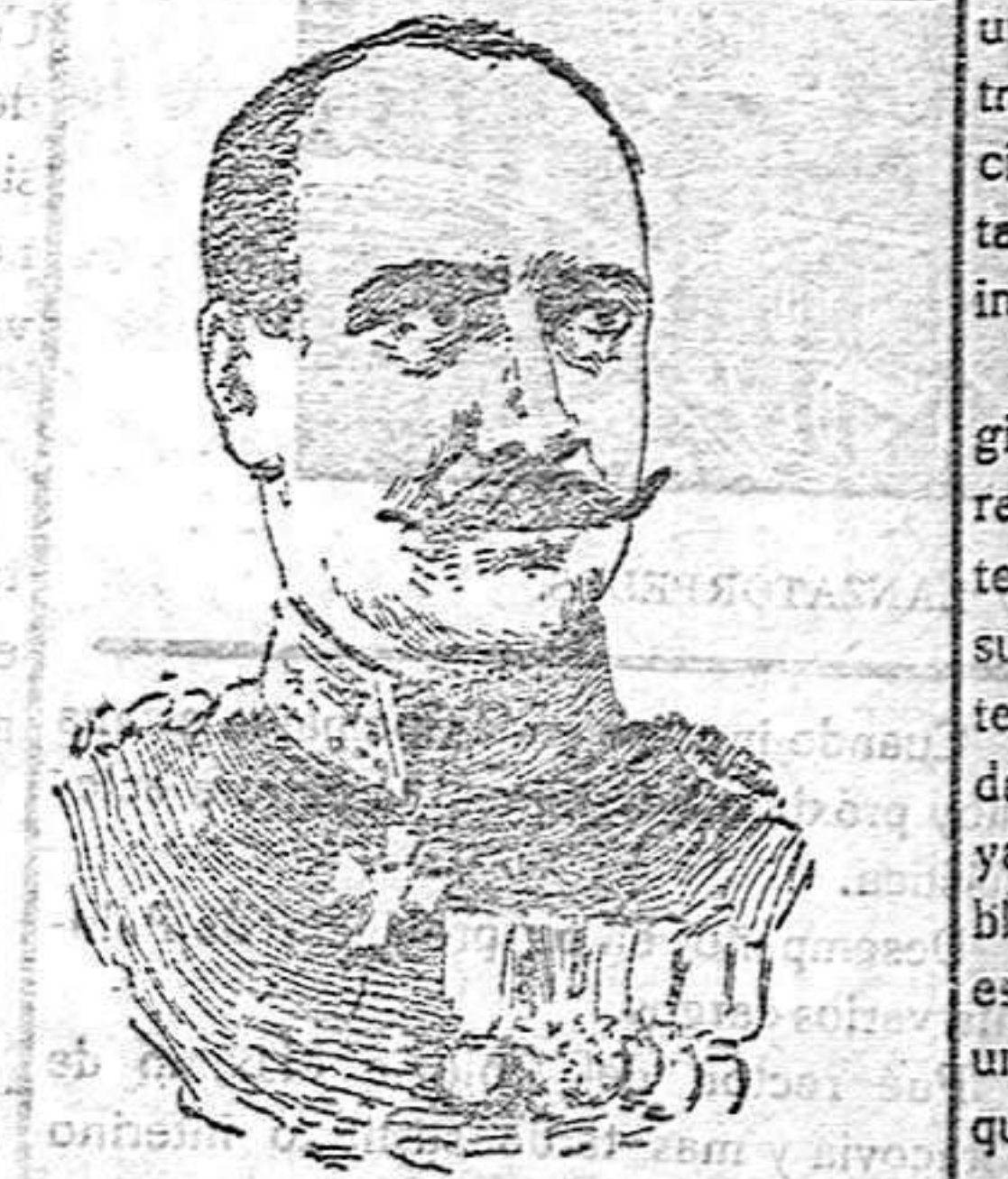
Figuras de la guerra GENERAL ALEMAN MANTEUFFEL DEL ESTADO MAYOR ALEMAN