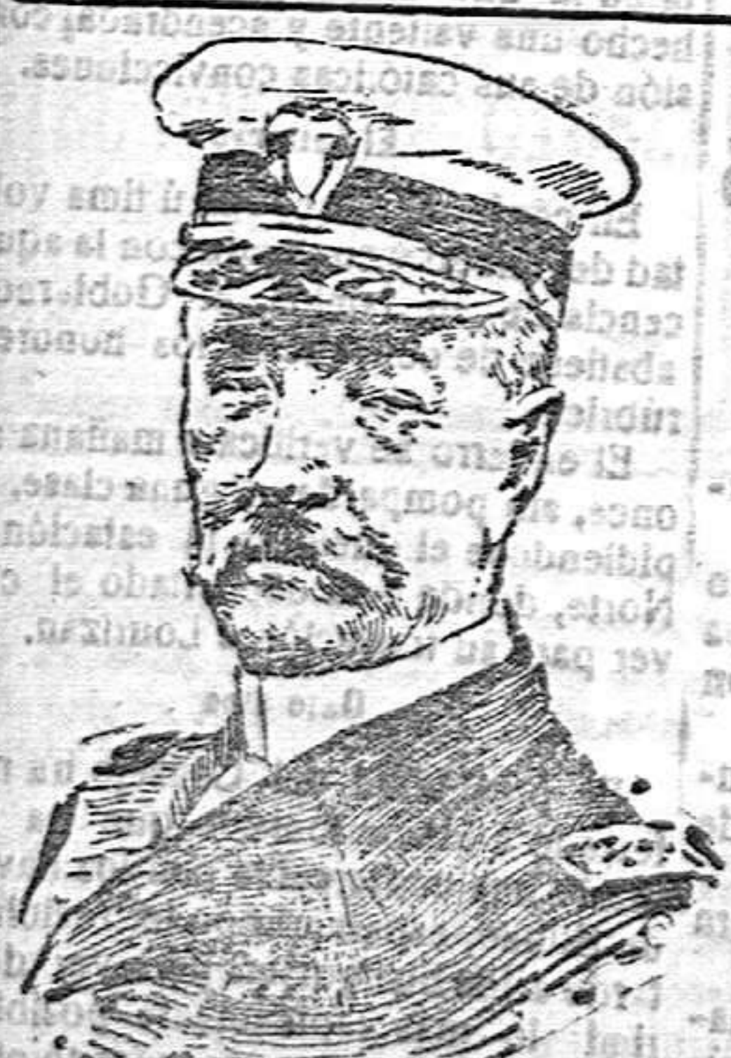
Jefe de la Escuadra Norte Americana del Pacifico POR TELEFONO