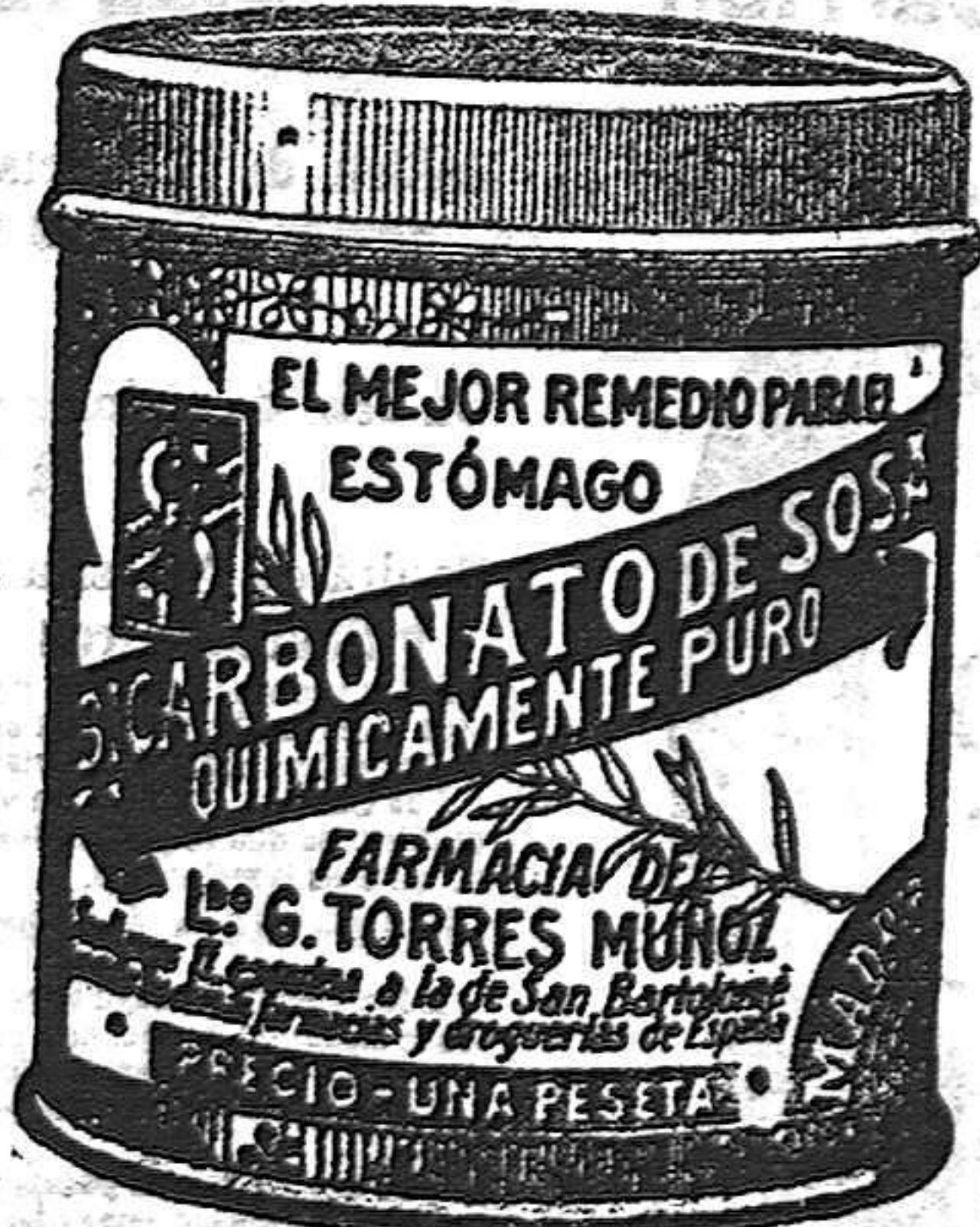
EL MEJOR REMEDIO PARA EL ESTÓMAGO

Se vende en las principales farmacias de Madrid y Sección, 36, Madrid