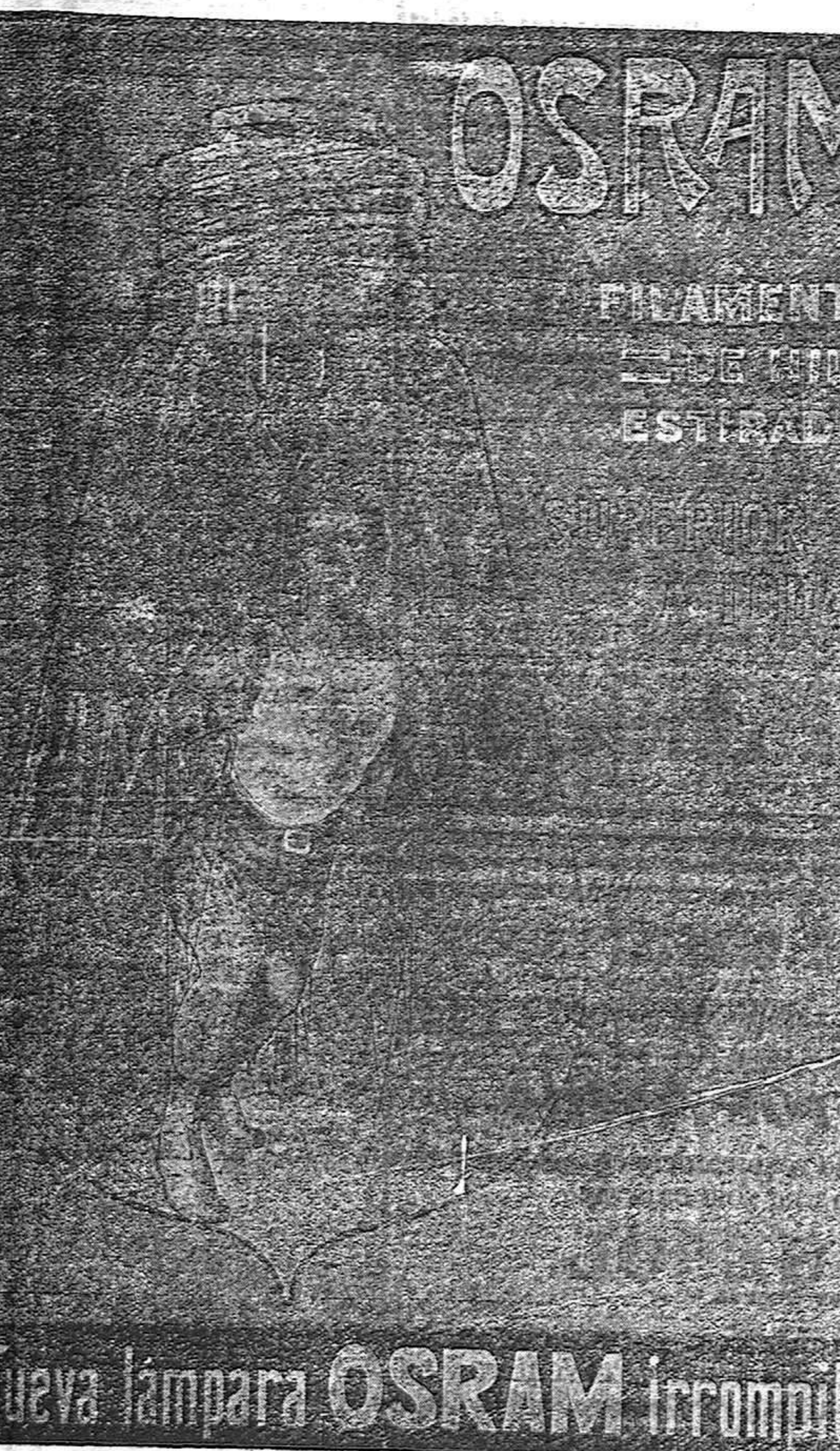
Nueva lámpara OSRAM irrompible