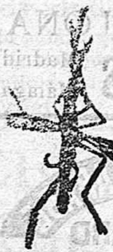
ANOFEELE Mosquito que propaga la fiebre Subida San Miguel 1, Barcelona patológica.

Previene el paludismo y lo cura entodas sus forma