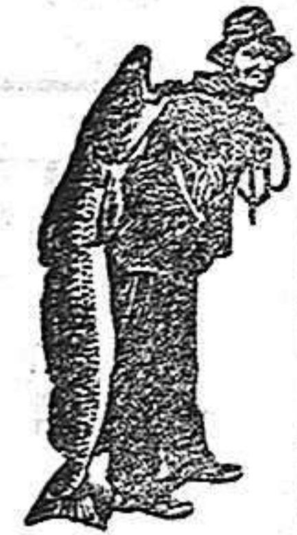
Obténase siempre la Emulsión con esta marca "El Pescador" marca del procedimiento Scott!