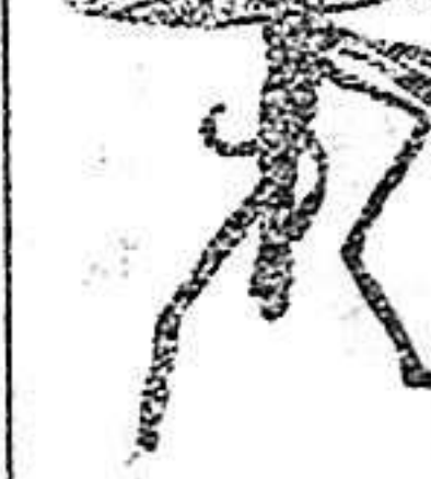
ANOFFLE Mosquito que propaga la fiebre palúdica.

Rogamos á los Sres. Doctores que lo ensayen en los casos que resultaren incurables con cualquier otro tratamiento, con la seguridad de que después no lo abandonarén nunca.