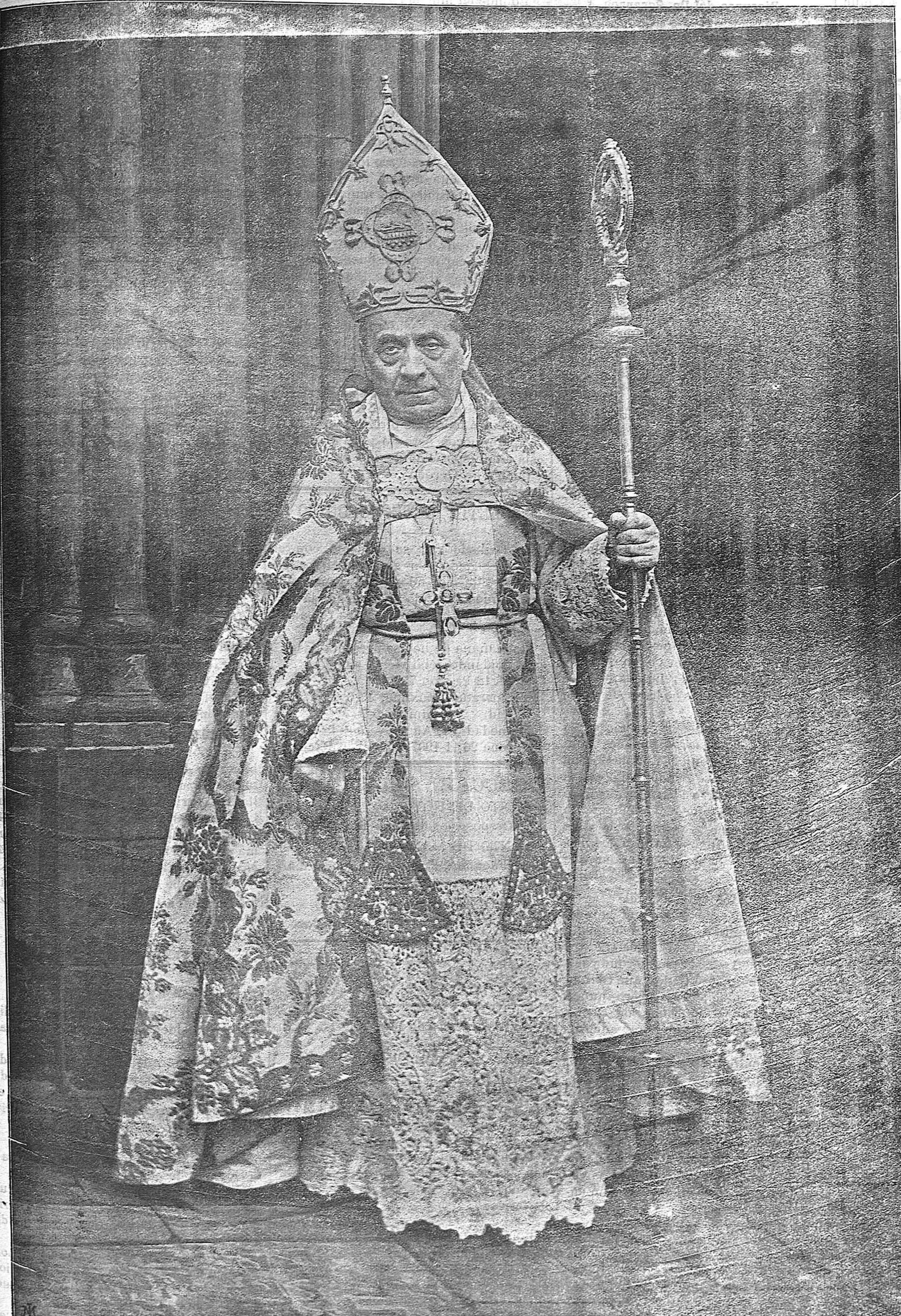
Emmo. Rdm. Salvador Casañas Pagés

Se le confió el economato de la importante parroquia de Ntra. Sra. del Pino de la misma ciudad, desempeñando admirablemente su ministerio sin menoscabo de la cátedra y del Vice-rectorado, pareciendo imposible y milagroso que un solo hombre pudiera alcanzar á sos