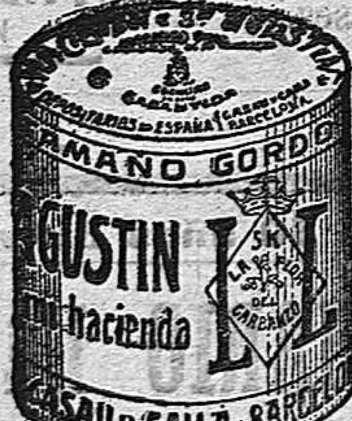
Garbanzo Sauce (5 Kilos)

ASMA y CATARRO Catarros y Asma OPRESIONES, TOS, NEURAS, NEURALGIAS El Fumigador Pectoral ESPIG es el más eficaz de todos los remedios para combatir la Asma y el Catarro de las Vías respiratorias. Esta medicina es os hospitalaria Francesa y Extranjera. Toda vez que se necesite en Francia y Extranjera. Por Mayor: 40, Rue de Valenciennes, PARIS. EXHIBE ESTA FIRMA SOBRE CADA CIGARRILLO.