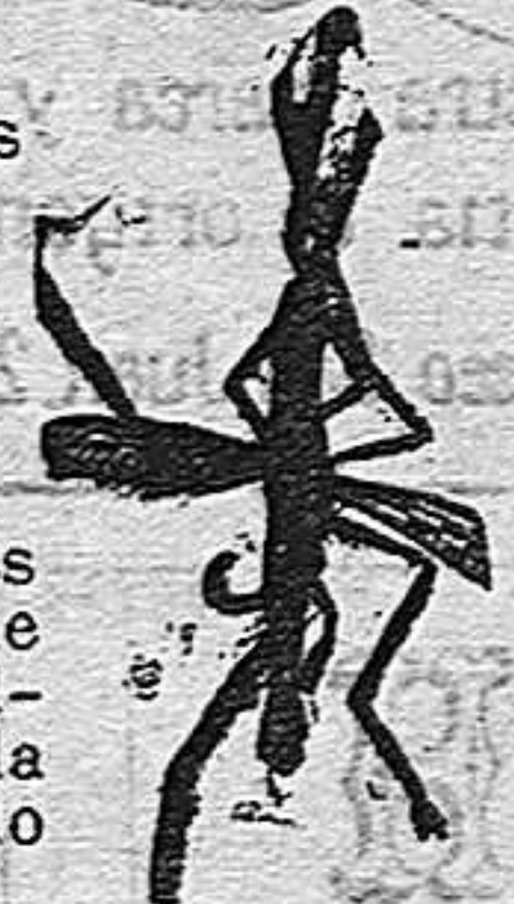
ANOFFLE Mosquito que propaga la fiebre palúdica.