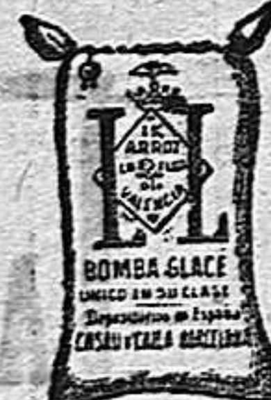
Arroz Glacé (1 kilo)