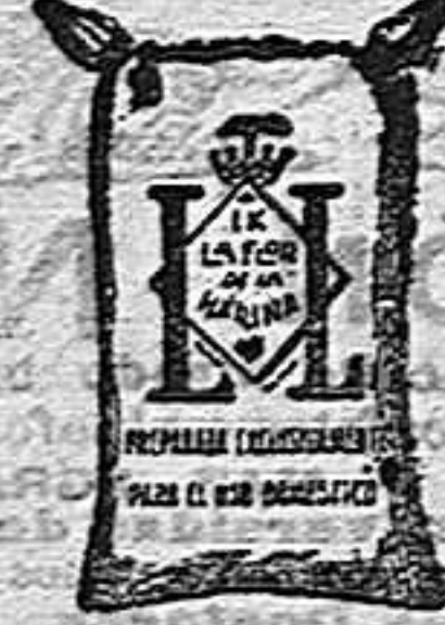
Macina Frappé (1 kilo)