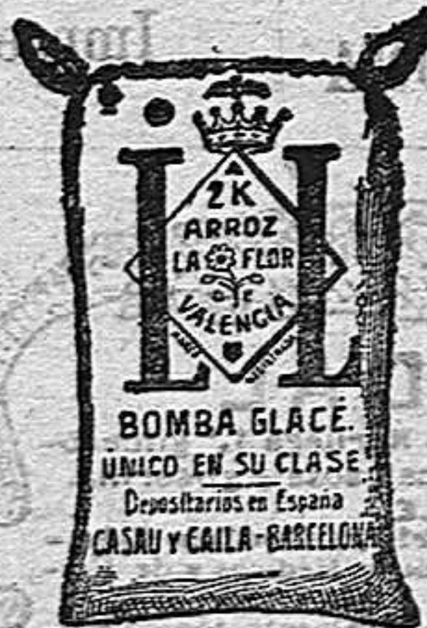
Arroz Glacé (2 Kilos)