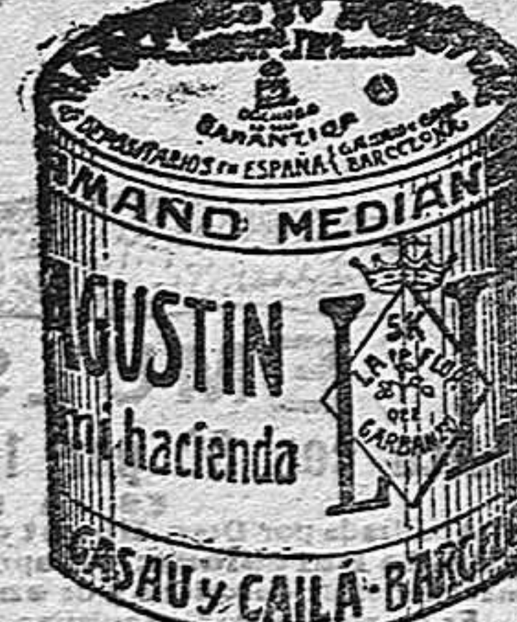
Garbanzo Sauce (5 Kilos)

Garantizamos al público que los comestibles empaquetados con nuestra marca son naturales de la planta, y sin contener la más pequeña adulteración en beneficio de ellos ni para hermosarlos, por lo cual nos hacemos responsables á todo análisis que quiera efectuarse.