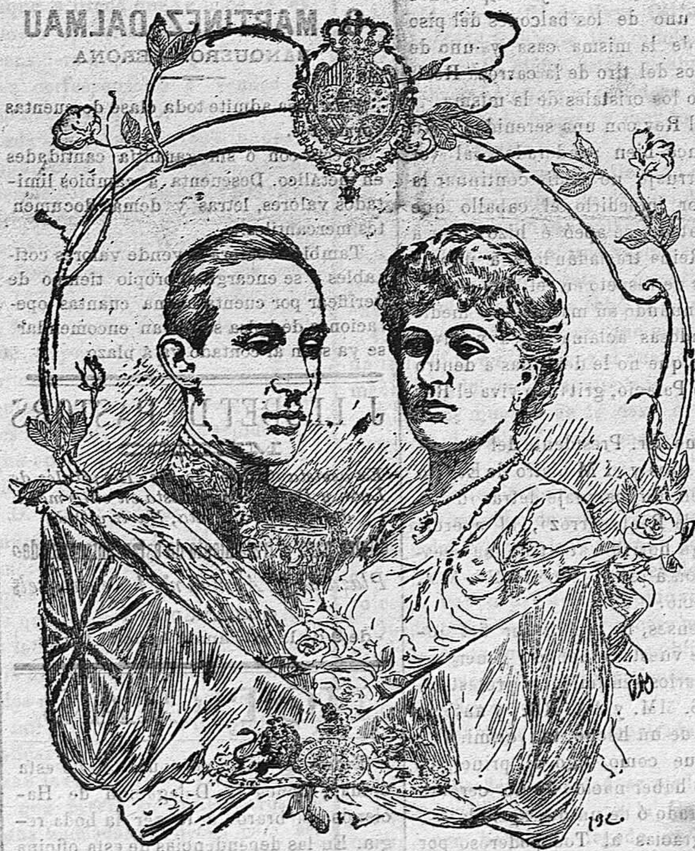
SS. MM. ALFONSO Y VICTORIA

Hay que ser prácticos; hay que ver las cosas con los ojos de la realidad y como decía Sagasta, ver de que lado se inclinan para cerciorarse hacia donde han de caer y la solidaridad catalana