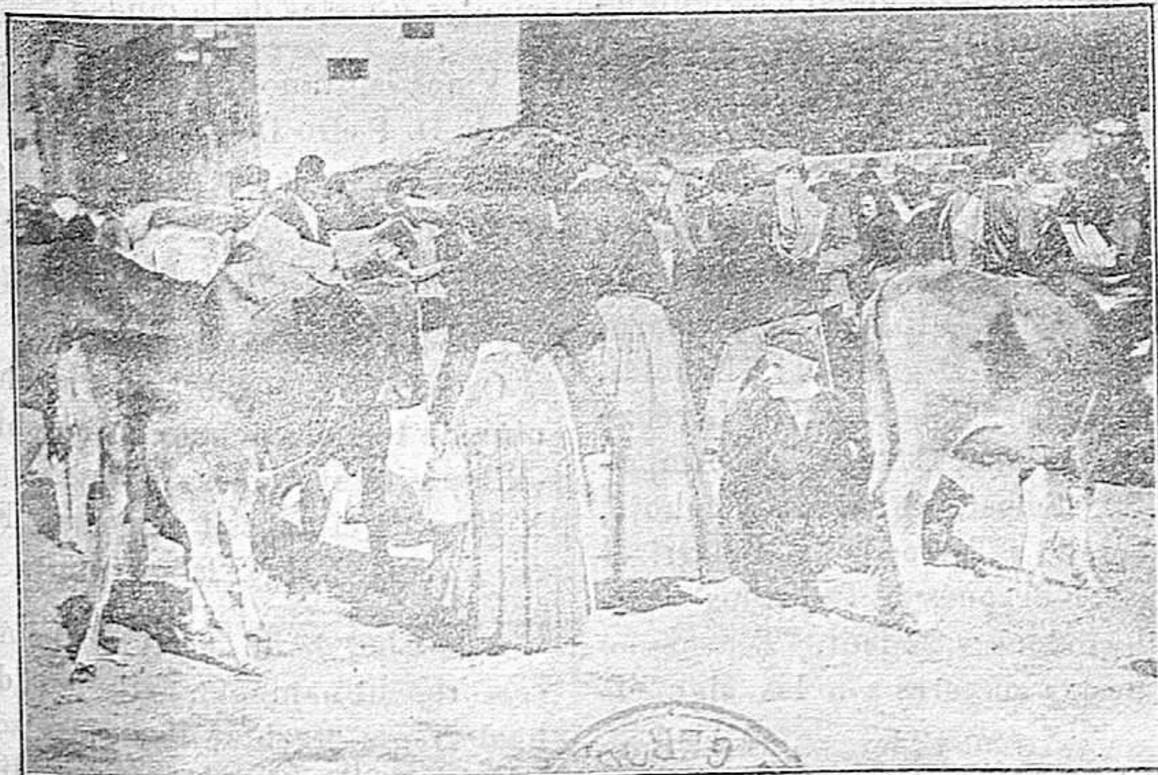
En el Areny.—Escenas de Mercado

A las 21.—Funciones dramáticas en las sociedades Círculo Católico de Obreros y Centró Moral .