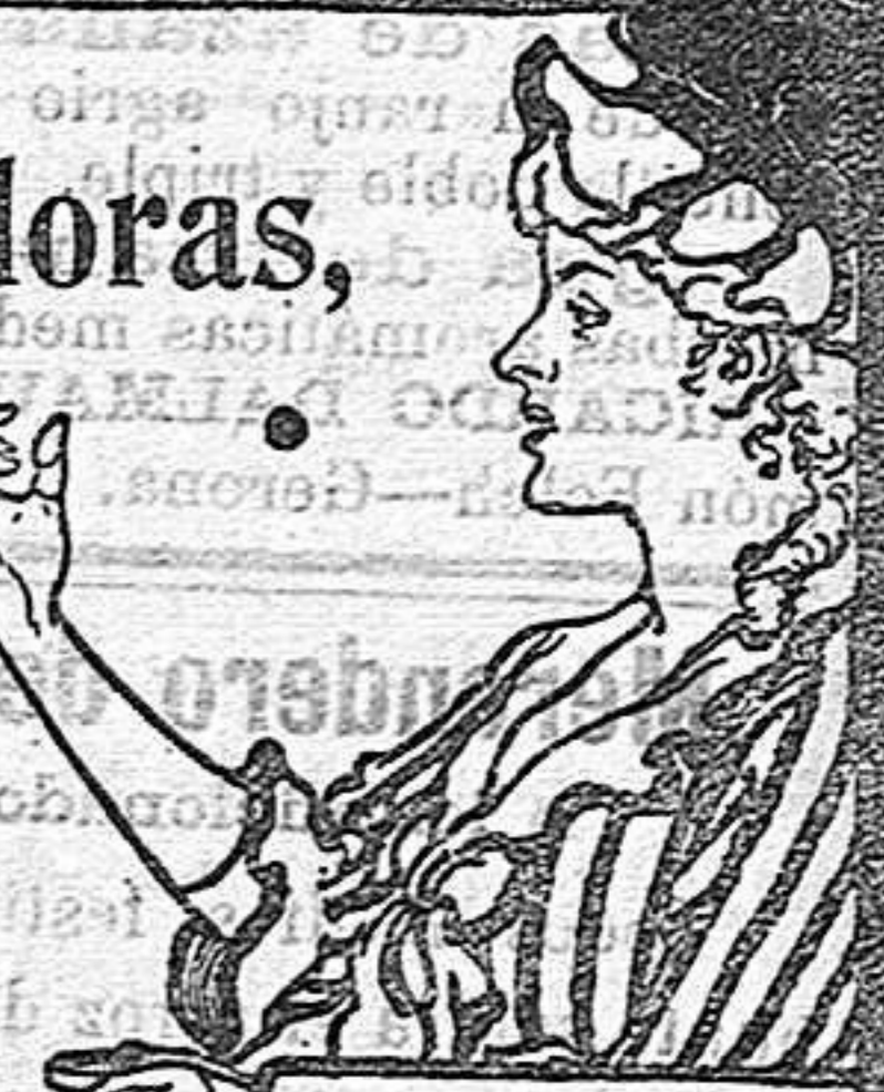
Acerque el grabado a los ojos y verá Vd. la píldora entrar en la boca.

DE VENTA EN LAS BOTICAS DEL MUNDO ENTERO. 40 Píldoras en Caja.