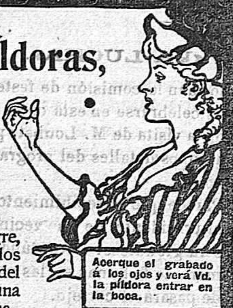
Aoerque el grabado a los ojos y verá Vd. la píldora entrar en la boca.

DE VENTA EN LAS BOTICAS DEL MUNDO ENTERO.