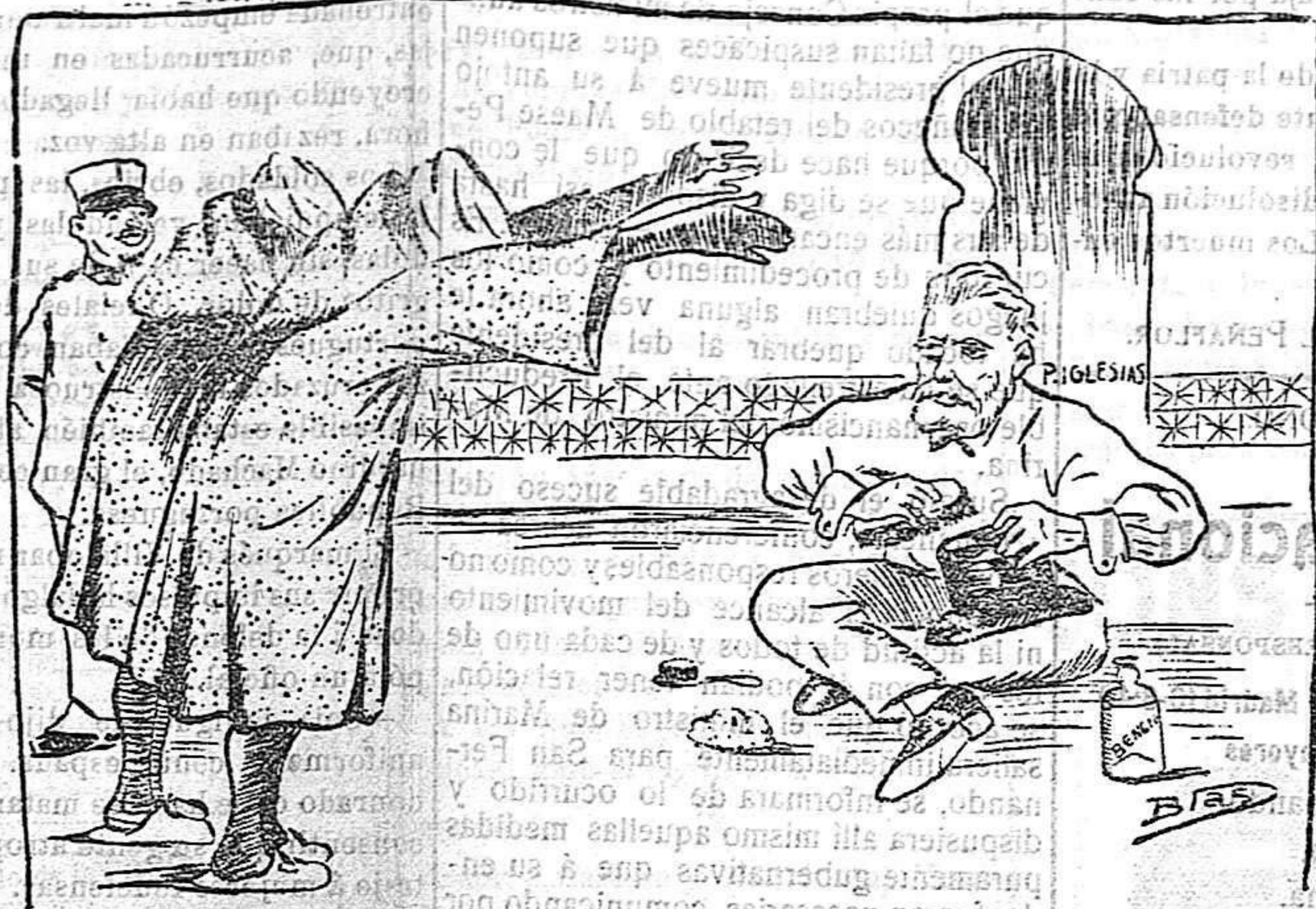
¡Alé te proteja! En nombre del Sultán y de nuestra aliada Francia te damos las gracias por tu campaña en pró de nuestros intereses y en contra de España. —Alá, Francia y nosotros te lo agradeceremos.