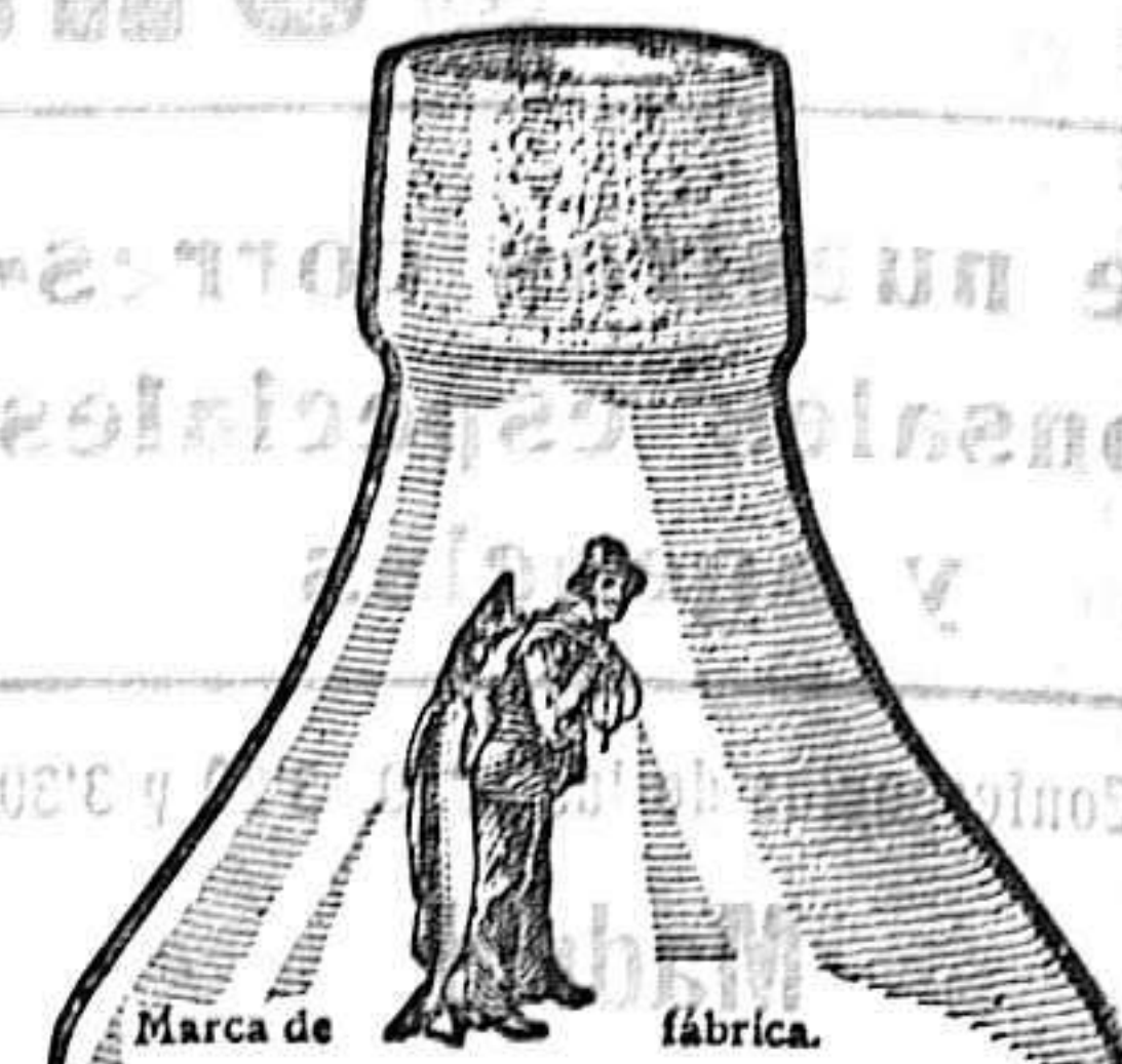
Marca de fábrica.

escrita por ISRAE ANTONINO; á dos pesetas ejemplar.