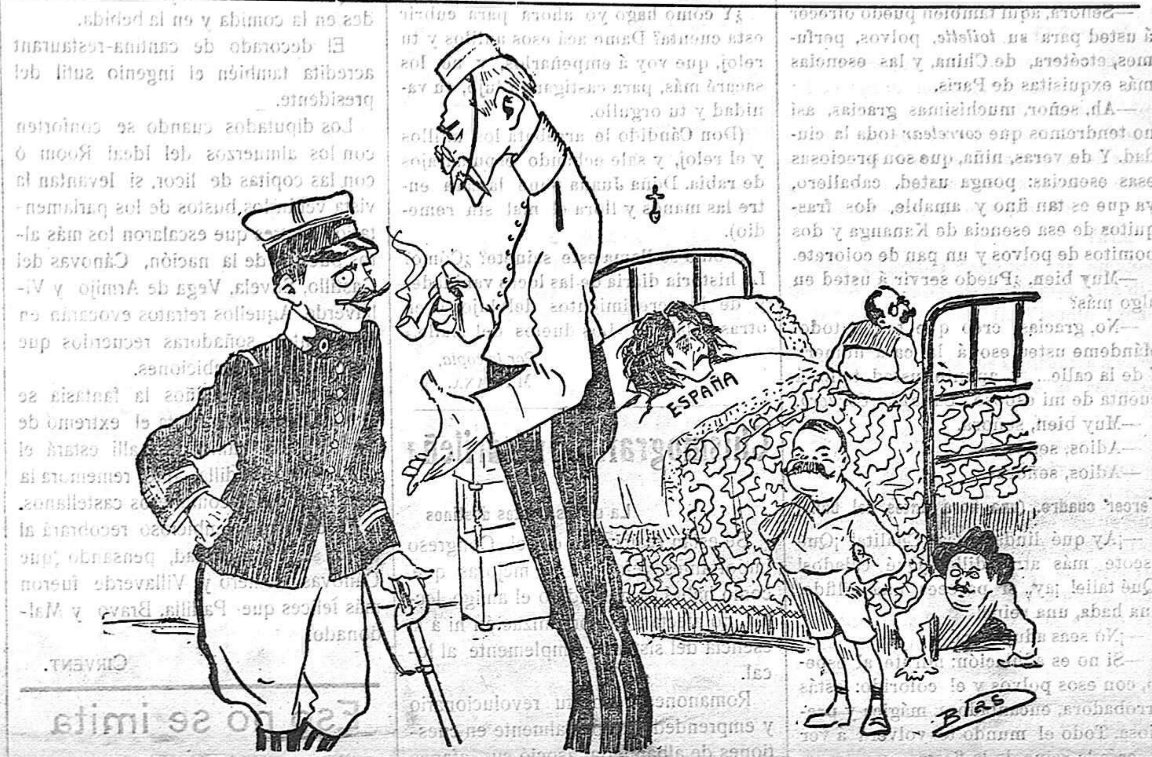
—Perdón, Mr. ¿Cómo la encuentra V. —¡Ah! Yo creer que está muy mala; y esos niños meter mucho ruido y ponerla peor....

Mas repetimos que el Sr. Canalejas ha perdido en esta ocasión los papeles.