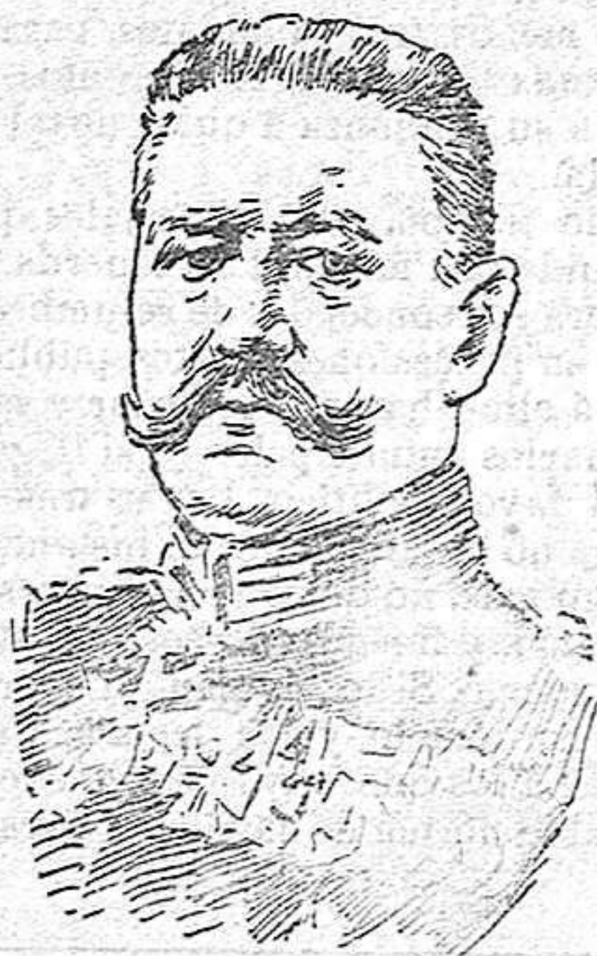
FIGURAS DE LA GUERRA

El general alemán VON HINDENBURG cuyo onomástico acaba de celebrarse en Alemania con gran regocijo por sus victorias sobre los rusos