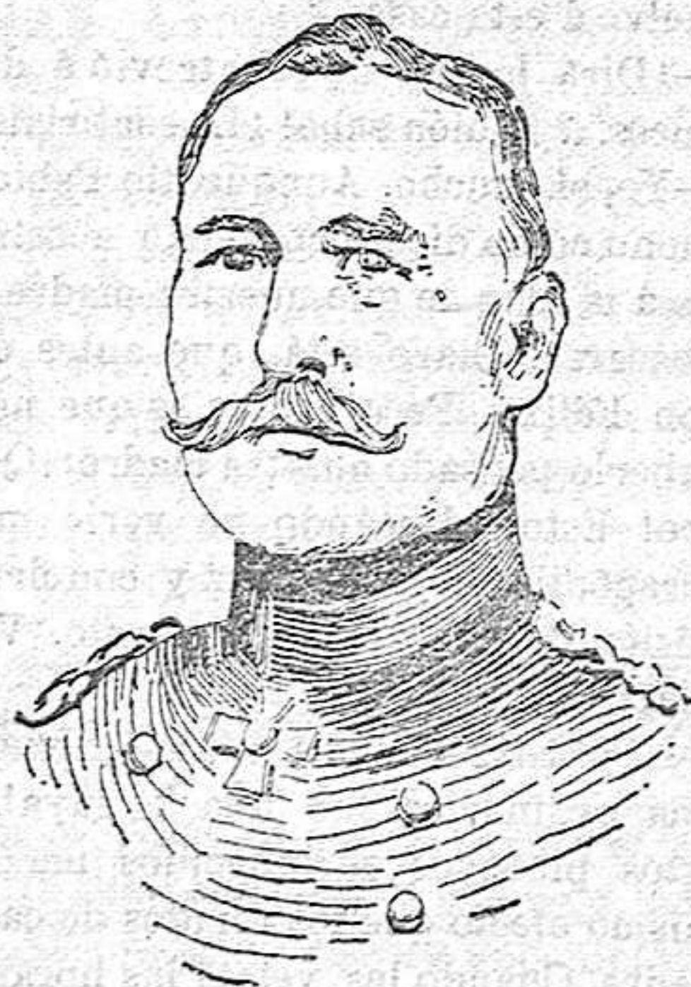
FIGURAS DE LA GUERRA

EL VON KLEIS que manda uno de los Cuerpos del ejército que opera en Flandes Guls Correter