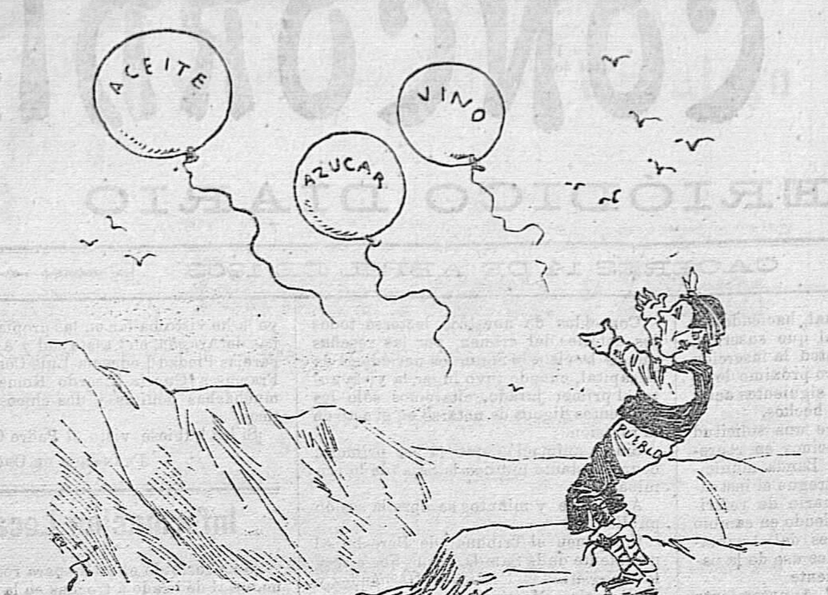
—Subir, subir, que el reventar se queda para nosotros!

Desde aquel día enfermó Alicia. Los facultativos que la reconocieron declararon francamente que ignoraban la dolencia que padecía la hermosa joven. Es lógico. ¡Para las enfermedades del alma son impotentes los recursos de la ciencia, puesto que ésta no puede descubrir el origen del mal.