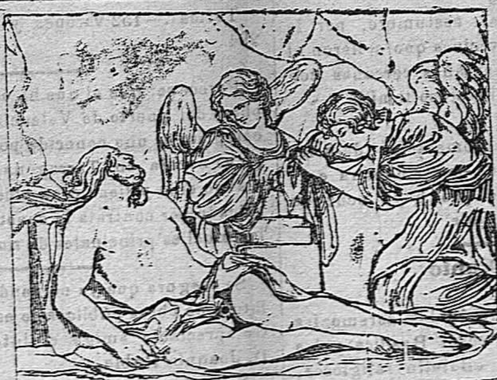
Jesús en el sepulcro (Barbieri.)