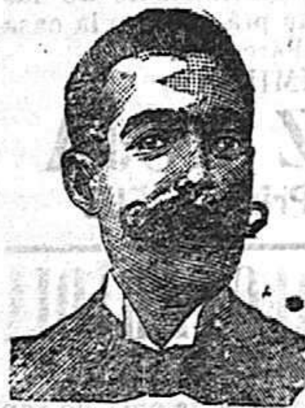
A. Salati Costanzi Diputación, 435, Barcelona

PROCURADOR ELECTO.—II Apodaca II 2.º 2.º—TARRAGONA