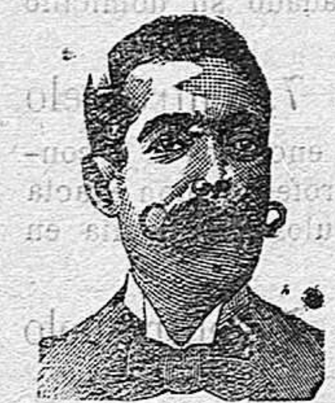
A. Salvati Costanzi Diputación, 435, Barcelona

Calle de la Unión, número 38.—TARRAGONA Variado y económico surtido de gorras y sombreros de todas clases 38, Unión, 38